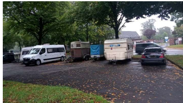
Langzeitparker im vorderen Bereich (29.8.)