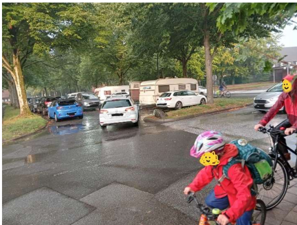
Es geht weder vor noch zurück (7:45 Uhr)

Nicht nur das Fehlen einer zweiten Ausfahrt, sondern auch die Langzeit-Nutzung durch Wohnwagen, Wohnmobile und Anhänger jeder Art (Bootstrailer, Pferdeanhänger, Kastenanhänger) zwingt die autofahrenden Eltern geradezu dazu, in die engen Straßen rund um die Schule einzubiegen oder halb-legal an Ecken oder Garagenhöfen zu halten.