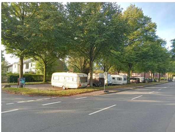
Unverändertes Bild heute morgen (13.09.)