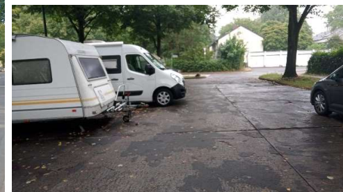
Übergroße Fahrzeuge lassen wenig Rangierplatz

Nachfragen bezüglich der Umsetzbarkeit der geplanten Maßnahmen beim Wegewart und PK26 haben ergeben, dass es Bedenken wegen der zweiten Ausfahrt gibt wegen der Gefährdung der Straßenbäume (Beschädigung der Baumwurzeln).