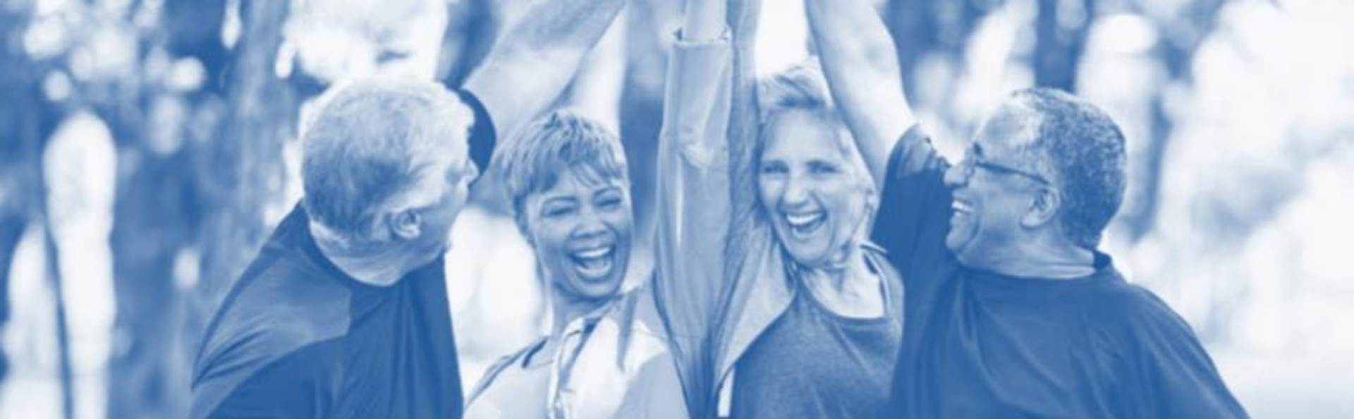
Foto: Älterwerden in Hamburg-Mitte