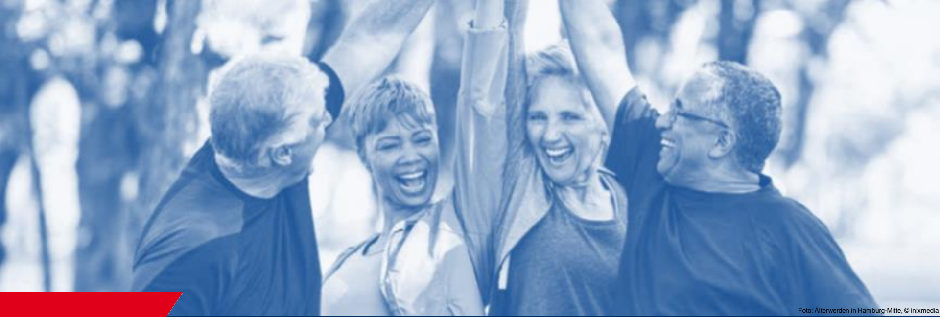
Foto: Älterwerden in Hamburg-Mitte