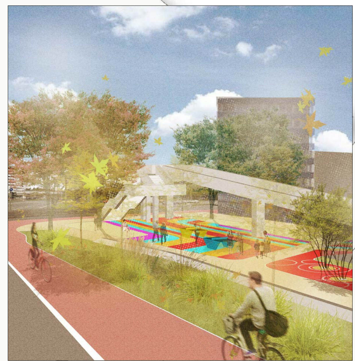
Blick auf die Aktionsfläche unter der Rampe