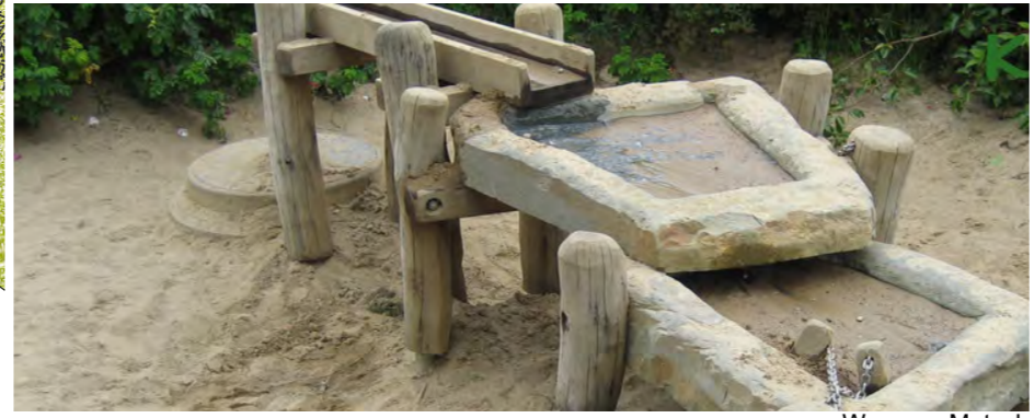
Wasser - Matsch