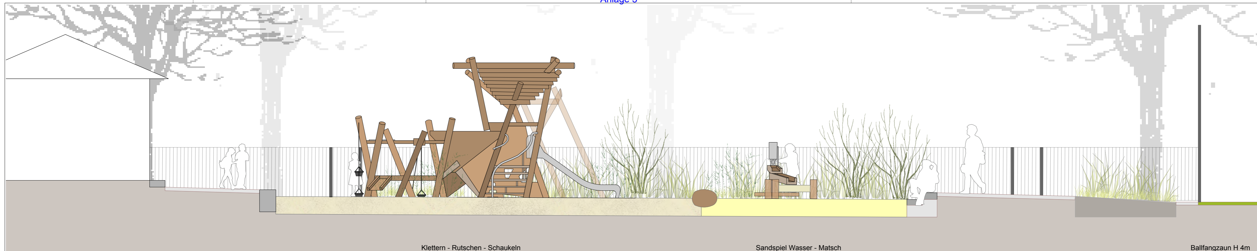
Klettern - Rutschen - Schaukeln