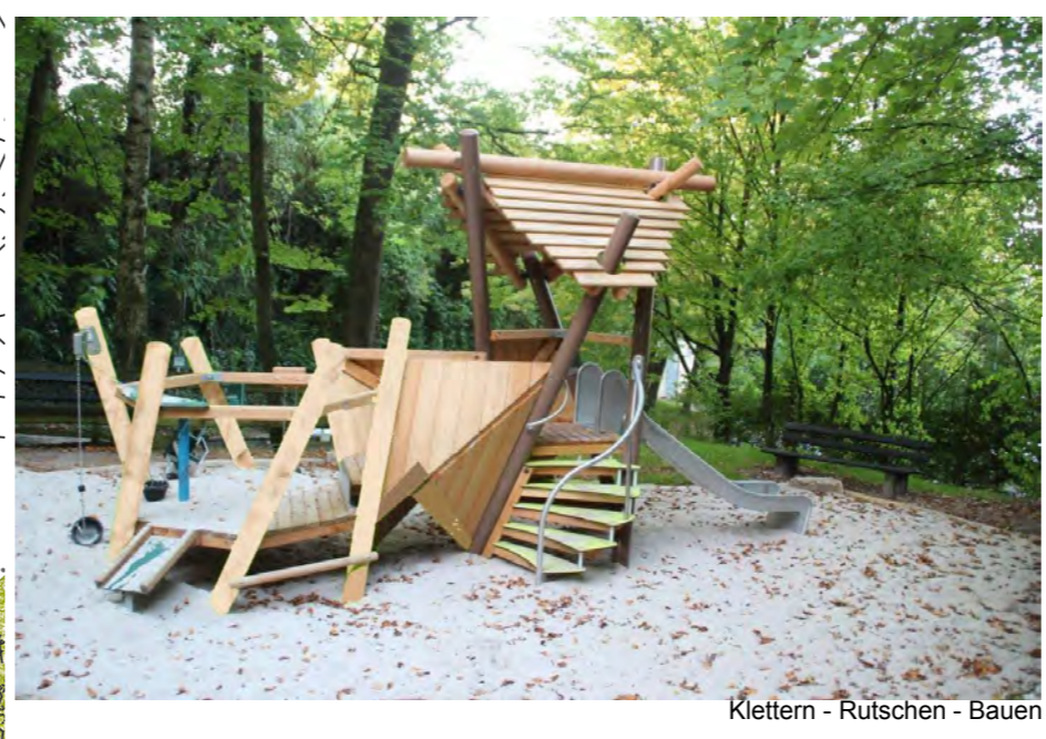
Klettern - Rutschen - Bauen