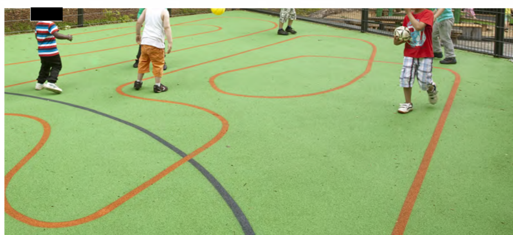
EPDM - Fallschutz