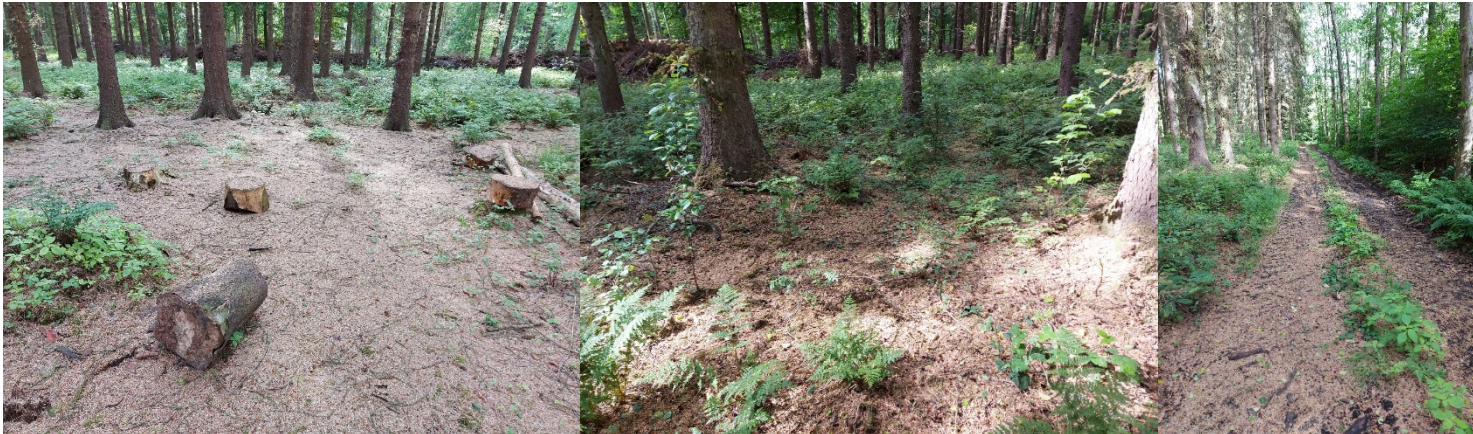
Bild 4-6: Zeigt den massiven Nadelabfall vor allem bei der Sitkafichte und teilweise anfangend auch bei der Rotfichte