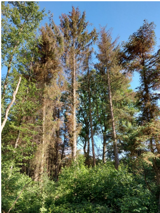
Bild 7-9: Zeigt sterbende Sitkafichte – die auch Einzelbaumweise im Bestand ausfallen und absterben und somit in einigen Bereichen im Hinblick auf die Verkehrssicherheit relevant werden.