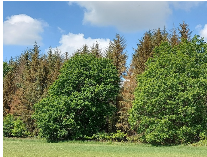
Bild 10-11: Zeigt weitere bereits abgestorbene Fichten sowie kleinere Teilbestände die massiv geschädigt sind.