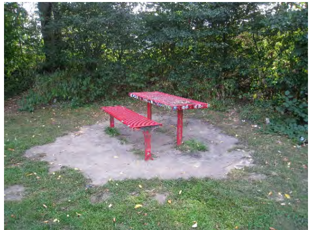
Bank 7 und Tisch (Bank 8 fehlt!)