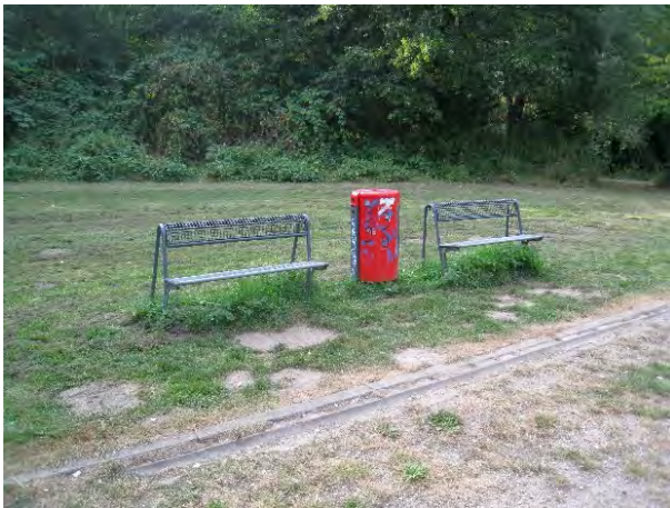
Bank 5 und 6