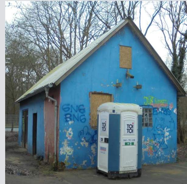
Zustand Nebengebäude Ende 2019