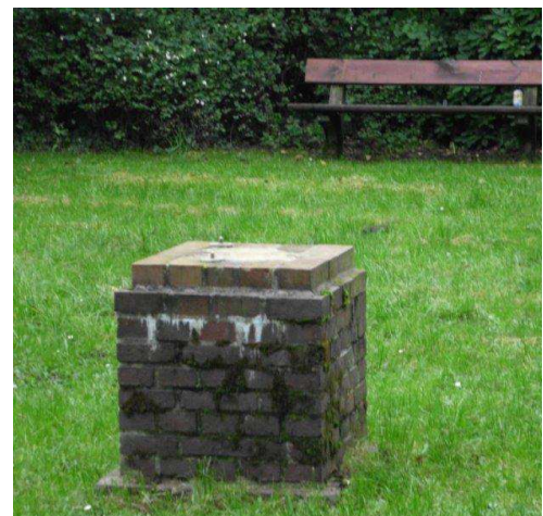
Leerer Sockel nach Diebstahl