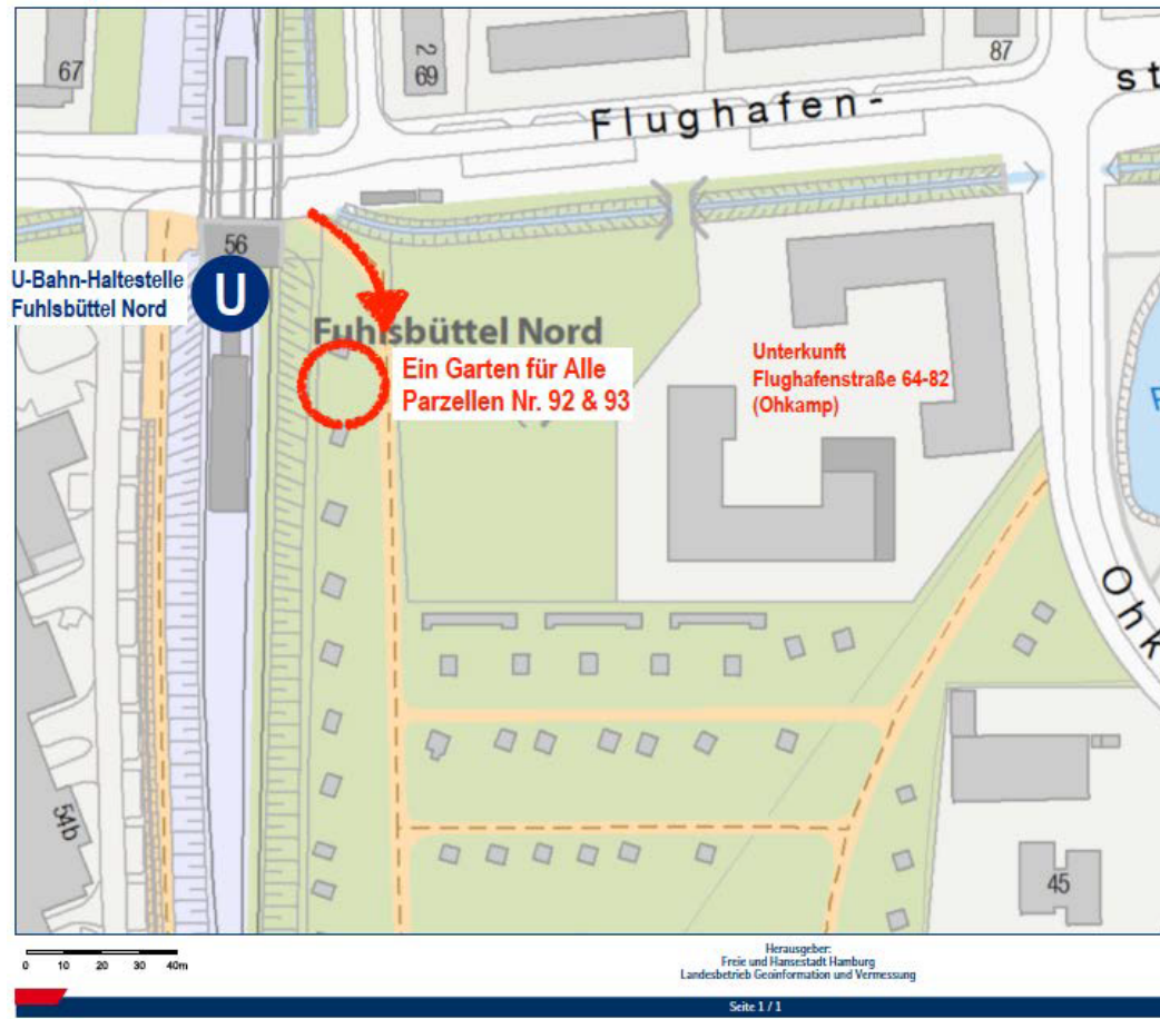
Ohkamp: Ein Garten für Alle