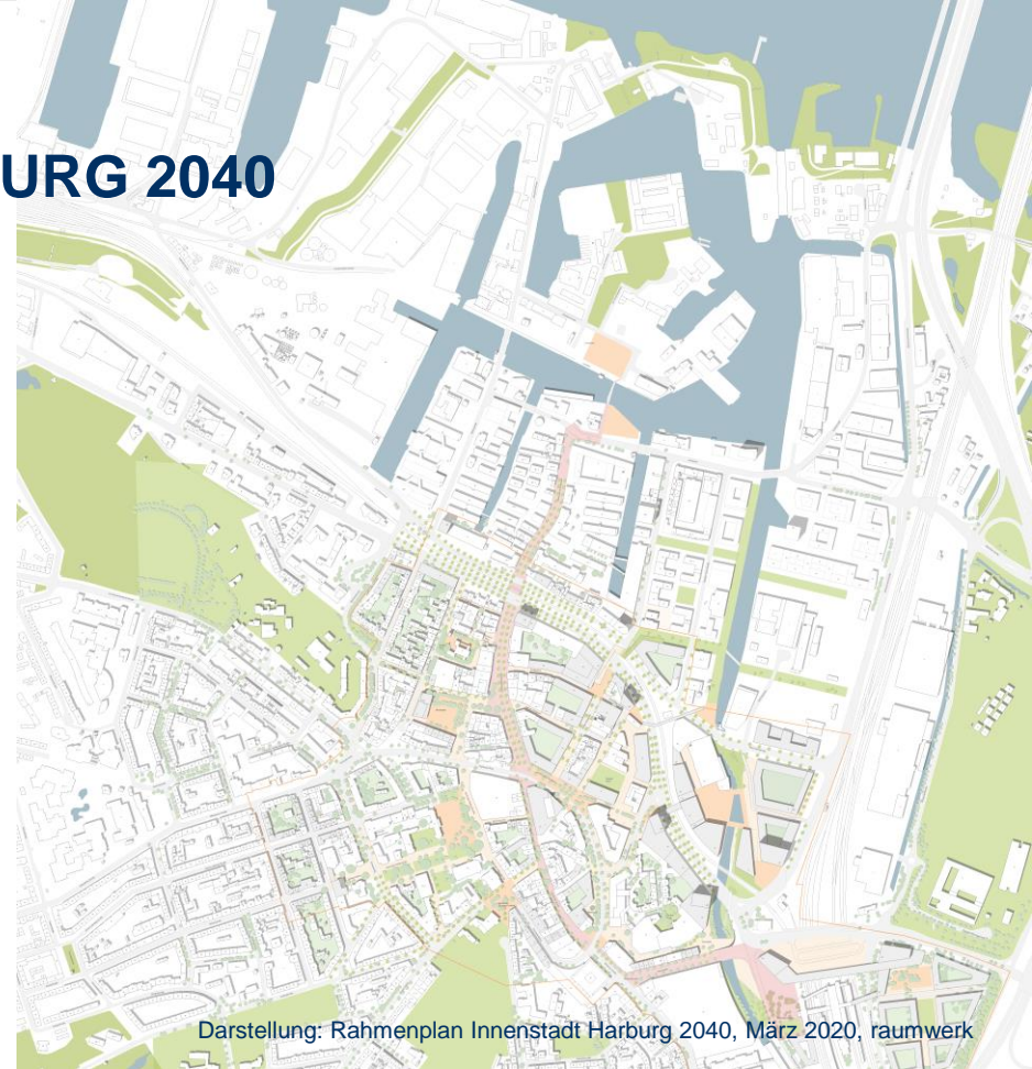
Darstellung: Rahmenplan Innenstadt Harburg 2040, März 2020, raumwerk

Klare Perspektive für die Innenstadtentwicklung