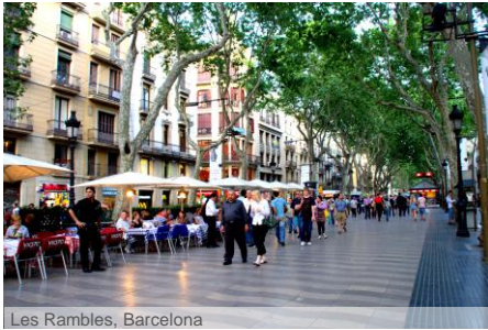
Les Rambles, Barcelona