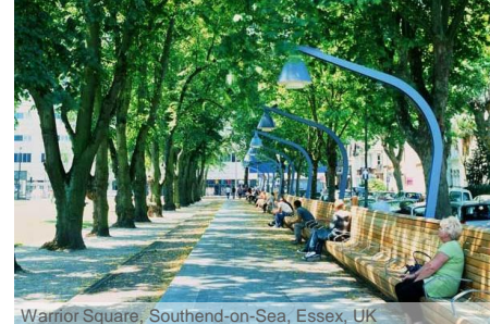
Warrior Square, Southend-on-Sea, Essex, UK