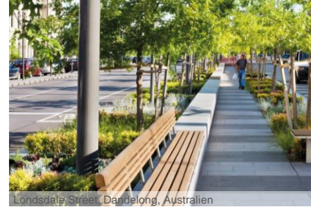
Londsdale Street, Dandelong, Australien