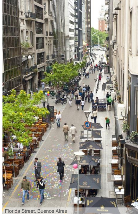
Florida Street, Buenos Aires