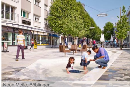
Neue Meile, Böblingen