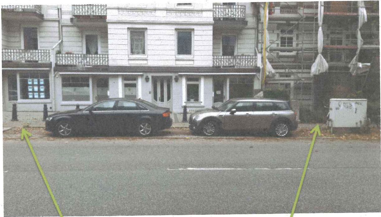
Foto / Skizze zum Vorgang E-Ladeplätze Martinistraße 26