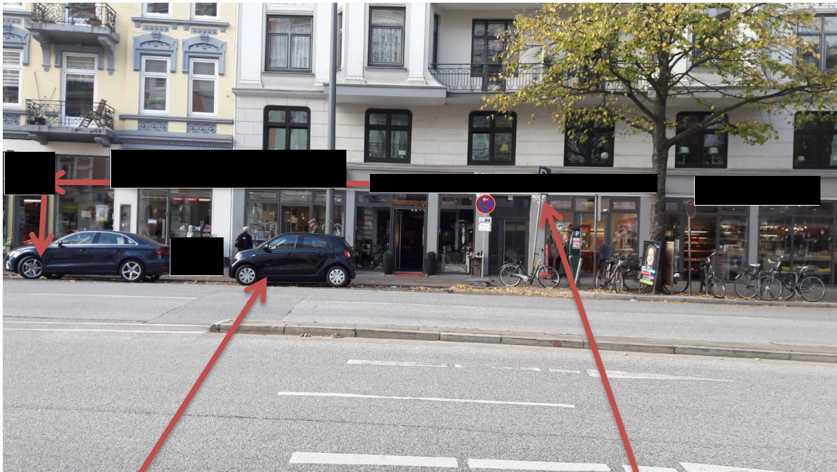
Foto / Skizze für E-Ladeplätze Eppendorfer Baum 41-43