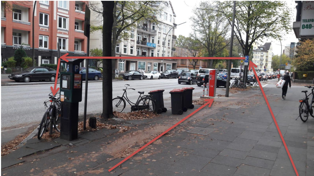
Foto / Skizze für E-Ladeplätze Tarpenbekstraße 47