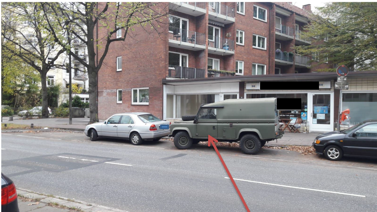
Foto / Skizze für E-Ladeplätze Breitenfelder Straße 16