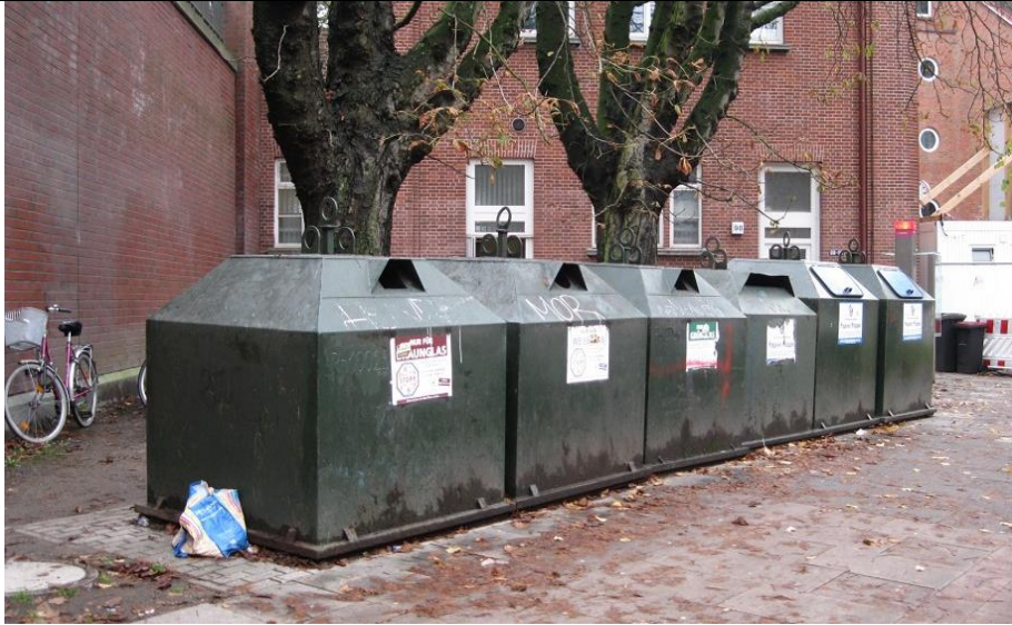
Nuer Standplatz Schlicksweg/Ecke Steilshooper Str.