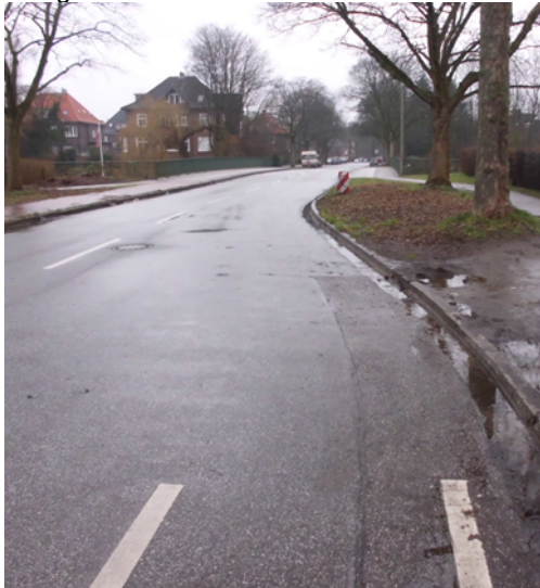
Wilhelm-Metzgerstraße Richtung Alsterkrugchaussee