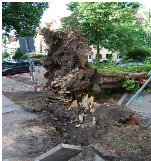
Erikastraße/umgestürzte Kastanie (Straßenbaum) aus 07.2008 – Ursache: Brandkruste!!