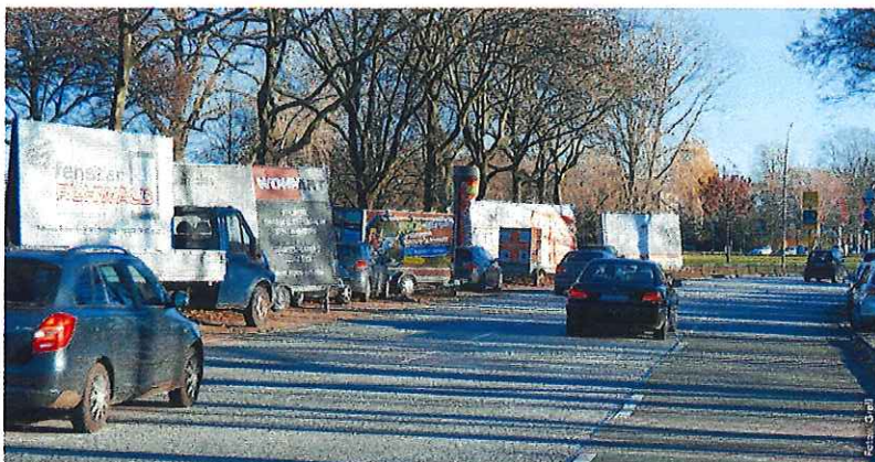
Der Horner Kreisel wird seit Jahren als kostenlose Werbefläche genutzt, damit soll nun bald Schluss sein

Werbeanhänger dürfen nicht mehr (um)geparkert werden