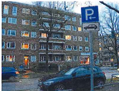
Schilder sollen nun die Parksituation eindeutig regeln, es dürfen nur noch Pkw abgestellt werden

Die Werbeanhänger, die kurz vor dem Horner Kreisel dauerhaft abgestellt werden, sorgen deshalb erst recht für großen Ärger. Der komplette Mittelstreifen ist durch die langen Anhänger blockiert und es schien bisher keine passende Lösung in Sicht, um das Abstellen der kostenlosen Werbeflächen zu untersagen.