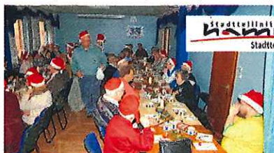
Passend zur Jahreszeit gibt es stimmungsvolle, weihnachtliche Lieder, Döntjes und Gedichte

Die drei ehrenamtlichen Veranstalter des „Nomiddags“ haben in ihr Dezemberprogramm jahreszeitengerecht einige