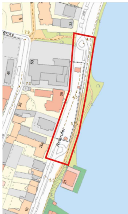
Abbildung 1: Planungsbereich der Maßnahme AlsterfahrradAchse Alsterufer US-Konsulat

Im Bereich des ehemaligen US-Generalkonsulats wurde bisher nur eine bauliche Zwischenlösung geschaffen, da die Straße „Alsterufer“ hier durch Sicherheitseinrichtungen (u.a. Sicherheitszaun, Durchfahrtssperren, Wärterhäuschen) abgesperrt und nur für direkte Anlieger freigegeben war. Nach dem Wegzug des US-Generalkonsulats in die Hamburger Hafencity haben sich die Randbedingungen in diesem Abschnitt grundlegend geändert. Die Sicherheitsinfrastruktur in diesem Bereich wird zeitnah zurückgebaut. Dies hat zur Folge, dass der öffentliche Raum zwischen Alster und den angrenzenden Grundstücken wieder frei zugänglich wird und daher im Zuge dieses Projekts überplant werden soll. (Siehe Abbildung 1)