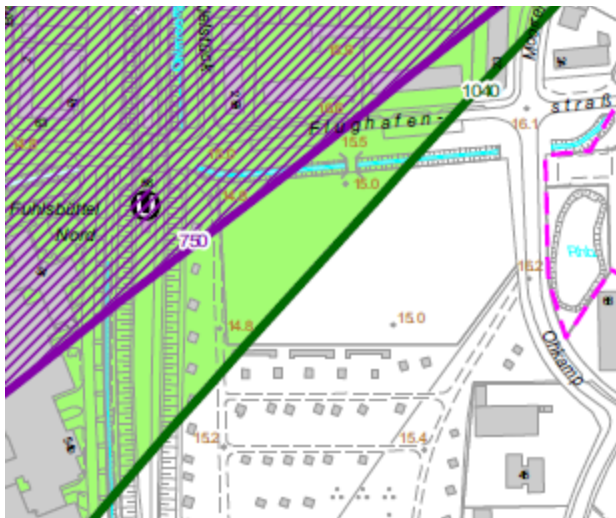
Lärmschutzbereich Verkehrsflughafen Hamburg gem. § 2 Abs. 2 Nr. 2 des Gesetzes zum Schutz gegen Fluglärm

Berücksichtigung des prägenden Bestandes möglich. Kerngebiete sind auch mit einem Wohnanteil zulässig, die planungsrechtliche Neuausweisung von neuen Wohngebieten ist im Regelfall dagegen nicht zulässig. Unter besonderen Umständen kann in außergewöhnlich gelagerten Einzelfällen auch anderes Handeln gerechtfertigt sein. Der akute Bedarf an geeigneten, verfügbaren und erschlossenen Flächen für die Unterbringung von Flüchtlingen und Asylsuchenden stellt einen besonderen Handlungsbedarf dar. Daher ist für den Plangebietsteil, der zu einem allgemeinen Wohngebiet entwickelt werden soll, ein Ausnahmebeschluss der Senatskommission erwirkt worden: Die Senatskommission für Stadtentwicklung und Wohnungsbau hat in ihrer 39. Sitzung am 20. Juli 2016 der planungsrechtlichen Ausweisung der Fläche als allgemeines Wohngebiet durch das Bezirksamt Hamburg-Nord entsprechend dem Bebauungsplan-Entwurf Fuhlsbüttel 23/ Langenhorn 83 im Rahmen der Ausnahmeregelung zum Senatsbeschluss zur Siedlungsplanung im fluglärmbelasteten Bereich des Flughafens Hamburg aus dem Jahre 1996 zum sog. Siedlungsbeschränkungsgebiet 2 zugestimmt.