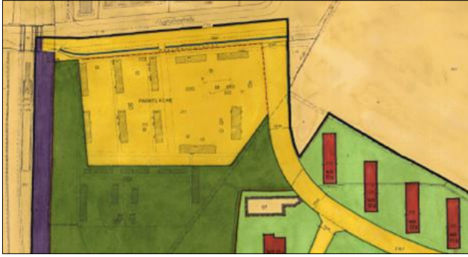
Ausschnitt B-Plan Fuhlsbüttel 4