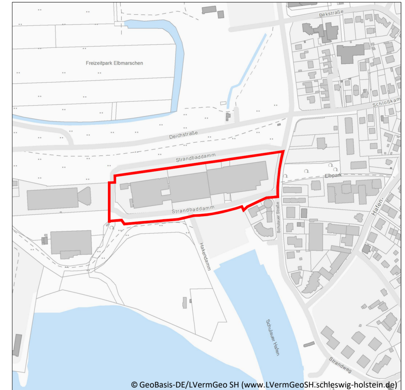
Übersichtsplan Maßstab 1: 5.000