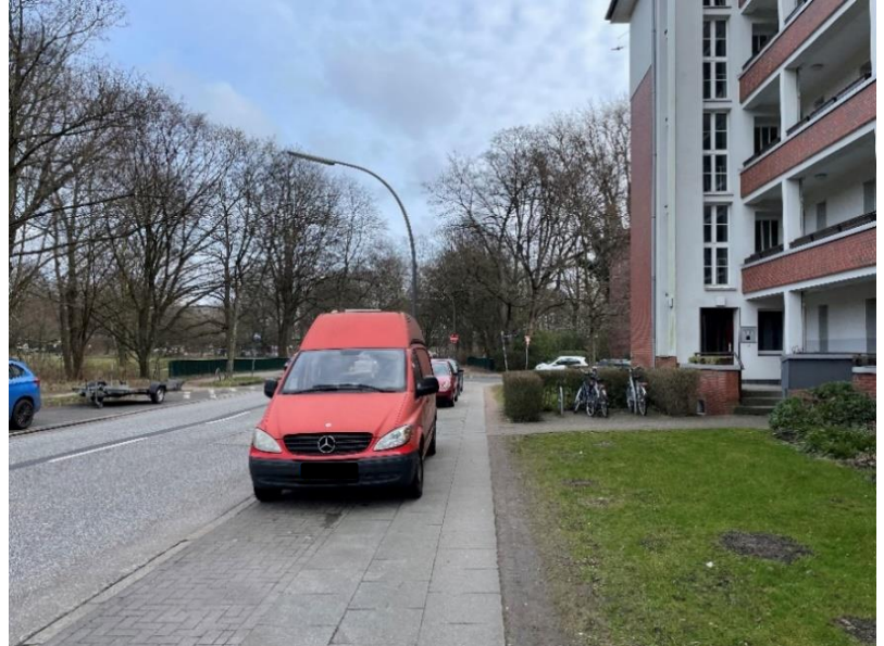
Abb. 5 und 6: Einschränkung des Gehweges durch Parken, Südseite

Um eine durchgängige Benutzbarkeit des Gehweges zu gewährleisten, müsste das Parken auf der Südseite um mindestens 1,10 m auf die Fahrbahn verschoben werden. Hierdurch ist ein Erhalt der Zweistreifigkeit ausgeschlossen, da die Mindestfahrbahnbreiten unterschritten würden. Es bestünde daher das Erfordernis, das Parken auf der Südseite grundsätzlich zu unterbinden. Eine weitere Möglichkeit wäre der Verzicht auf eine Fahrspur. Das Parken könnte dann ganz- oder halbachtig auf der Fahrbahn realisiert werden.