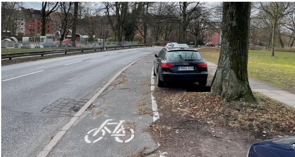
Abb. 4: Kopenhagener Radweg | Quelle: W/MR21

Die angesprochene Querungsstelle ist derzeit ungesichert. Da die Querung von Osten in einer Überfahrt liegt, ist sie für Blinde aus dieser Richtung nicht wahrnehmbar. Von Westen muss zunächst der Radweg niveaugleich überquert werden. Der Aufstellbereich befindet sich auf dem Radweg. Da zwei Fahrstreifen aus derselben Richtung vorliegen und aufgrund der Lage in einer Kurve, kann kein Fußgängerüberweg angeordnet werden.