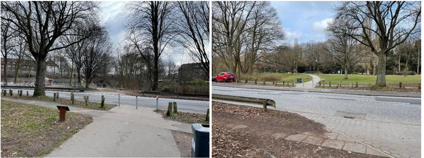
Abb. 2 und 3: vorh. Querung Wandse-Wanderweg von West und Ost

Die angesprochene Querungsstelle ist derzeit ungesichert. Da die Querung von Osten in einer Überfahrt liegt, ist sie für Blinde aus dieser Richtung nicht wahrnehmbar. Von Westen muss zunächst der Radweg niveaugleich überquert werden. Der Aufstellbereich befindet sich auf dem Radweg. Da zwei Fahrstreifen aus derselben Richtung vorliegen und aufgrund der Lage in einer Kurve, kann kein Fußgängerüberweg angeordnet werden.