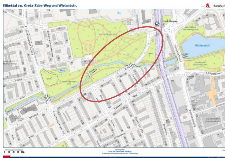
Abbildung 1: Lage im Raum | Quelle: Geoportal Hamburg

In der folgenden Abbildung ist der Planungsbereich in der Örtlichkeit zu sehen.