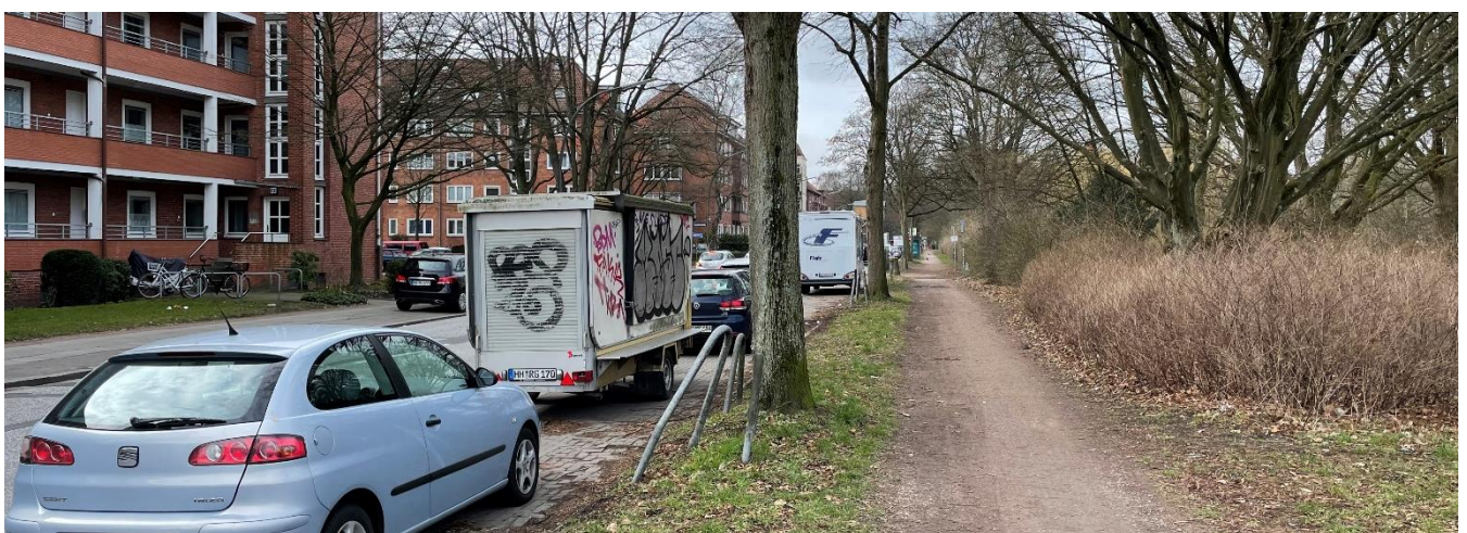
Abb. 7: Ehemaliger Radweg und Gehweg hinter Grünstreifen, Nordseite

Um eine durchgängige Benutzbarkeit des Gehweges zu gewährleisten, müsste das Parken auf der Südseite um mindestens 1,10 m auf die Fahrbahn verschoben werden. Hierdurch ist ein Erhalt der Zweistreifigkeit ausgeschlossen, da die Mindestfahrbahnbreiten unterschritten würden. Es bestünde daher das Erfordernis, das Parken auf der Südseite grundsätzlich zu unterbinden. Eine weitere Möglichkeit wäre der Verzicht auf eine Fahrspur. Das Parken könnte dann ganz- oder halbachtig auf der Fahrbahn realisiert werden.