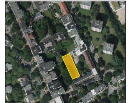
Luftbild genordet Lage der Garage ist gelb markiert