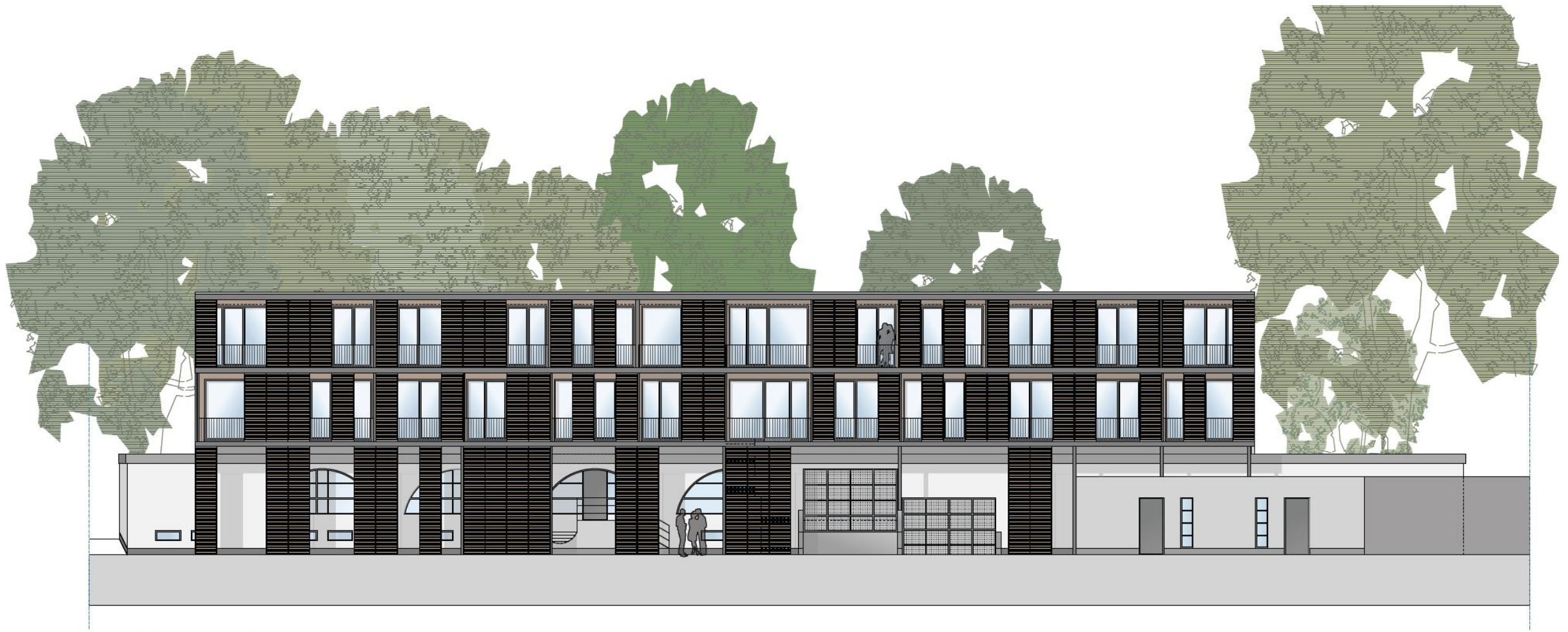
Ansicht mit Sonnenschutz verschiebbare Lamellenrahmen