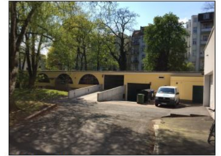
Foto Bestandsgarage Blick vom Innenhof