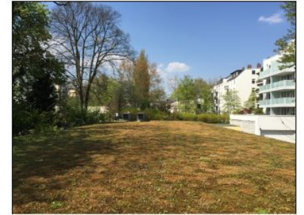
Foto Bestandsgarage Blick auf dem Dach