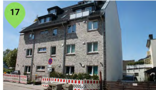
Neuer Weg 50