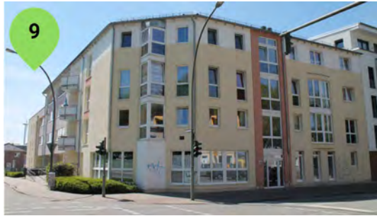
Holtenklinker Str. 108