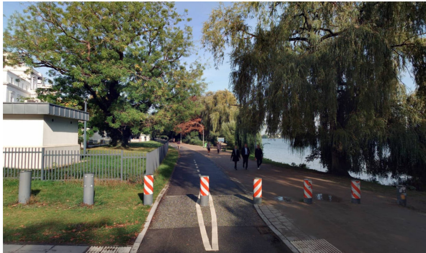
Blick auf den getrennten Rad- und Fußweg, Blickrichtung Nord