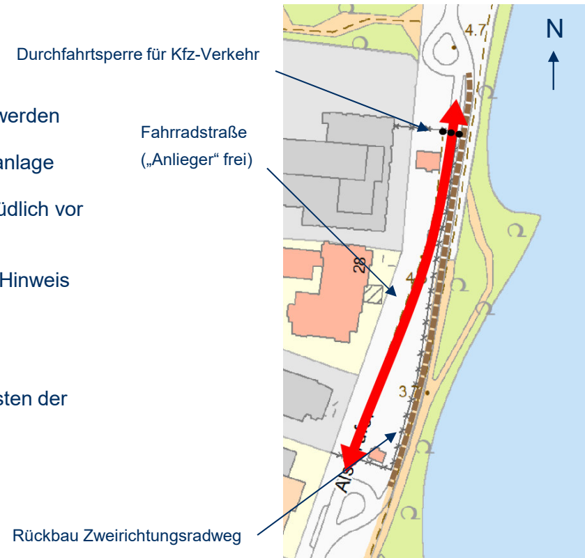
Prinzipische Skizze (Quelle: FHH-Atlas)