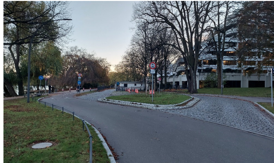
Nördliche Wendeschleife, Blickrichtung Süd