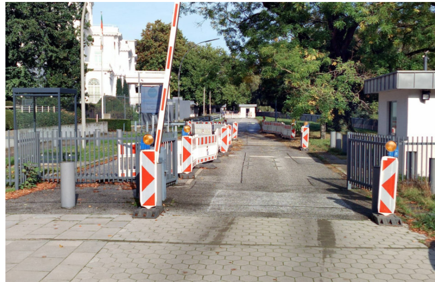
Zustand der bisherigen Fahrbahn