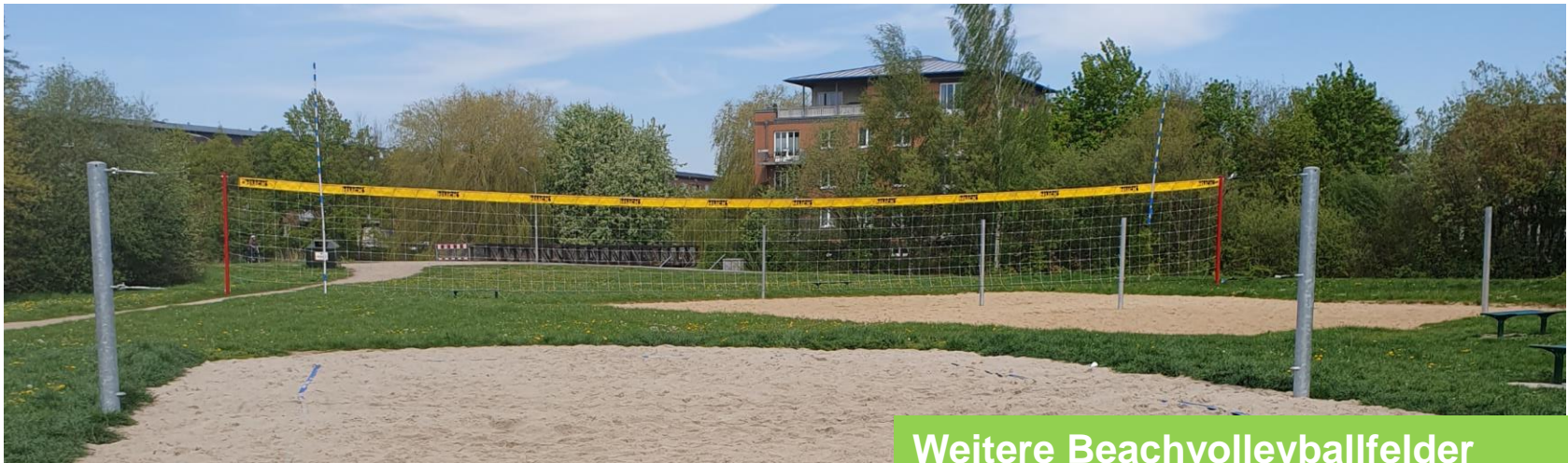
Weitere Beachvolleyballfelder am Allermöher See