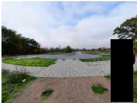
32 Elly-See-Str.: 3 große Flächen am Wendehammer