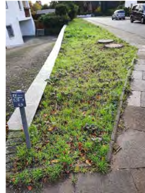
20 neben Sprützwiese 37