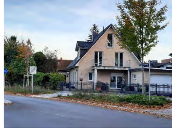
13 vor Elbgaustraße 214 / 216