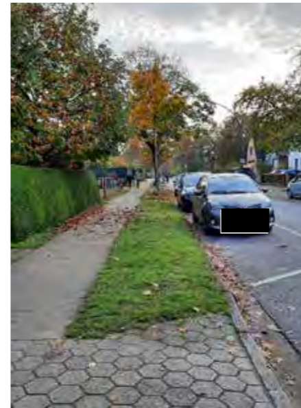
33 vor Flurstraße 29