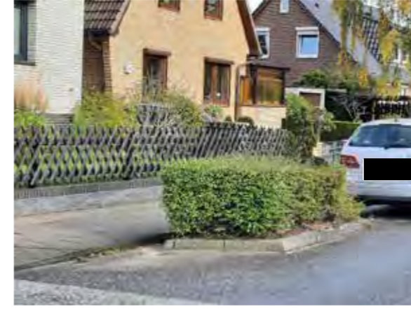
19 vor Sprützwiese 34