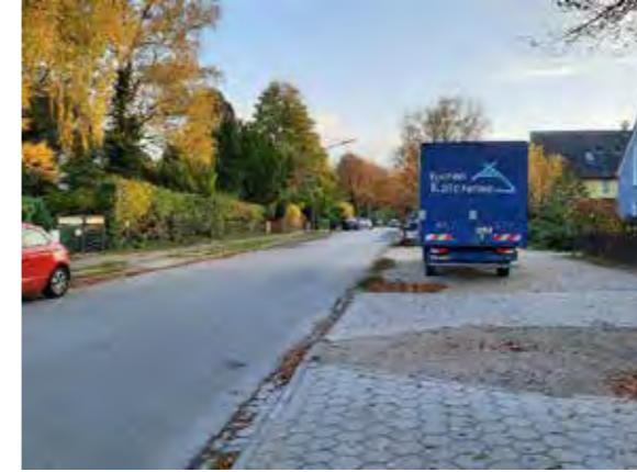
4 Jevenstedterstraße: Baumallee