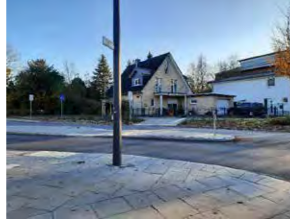
14 vor und gegenüber Farnhornweg 77