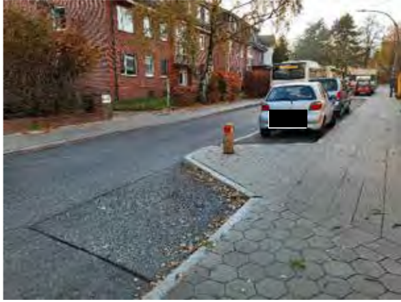
15 vor Farnhornweg 24/26/40/42/44/31/33