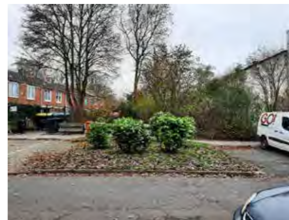
55 vor Peenestraße 4 / 20