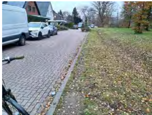
58 Am Sprützmoo76 Graben Ostseite: Baumreihe