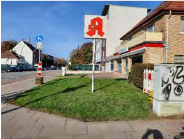
1 vor Luruper Hauptstraße 176 / grüner Platz