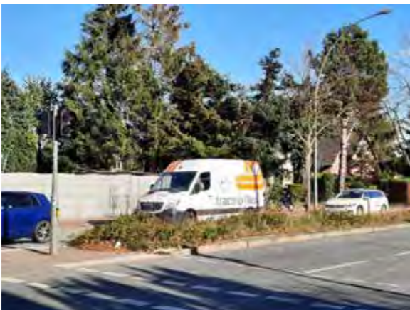
45 Farnhornweg ab Einmündung Langbargheide