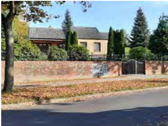
23 vor Böttcherkamp 90