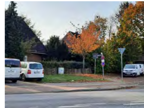
21 gegenüber Luruper Hauptstraße 298