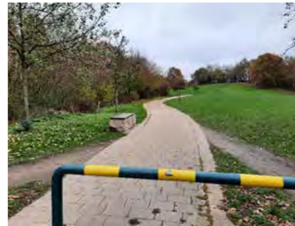
53 Stückweg: Baumallee als Parkeingang