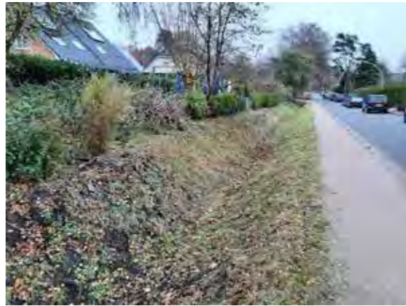
57 Sprützwiese, Baumreihe entlang Graben