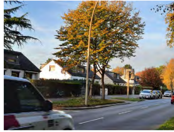
11 vor Elbgaustraße 202