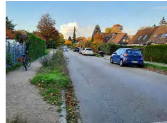
4 Jevenstedterstraße: Baumallee