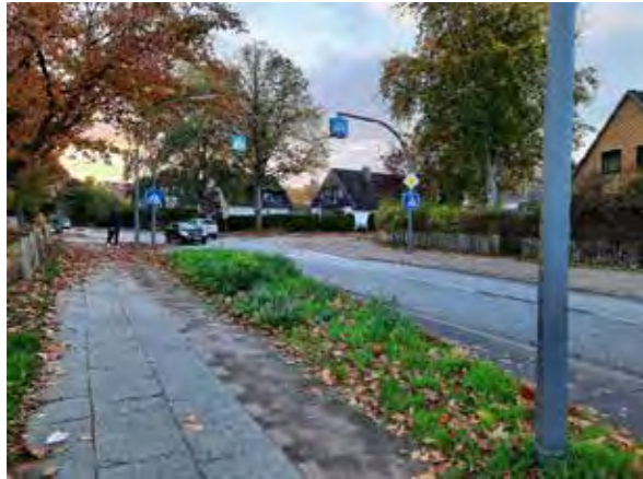
8 Fahrenort / Ecke Jevenstedterstraße