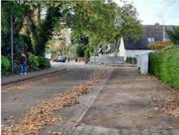
17 gegenüber Kleiberweg 105