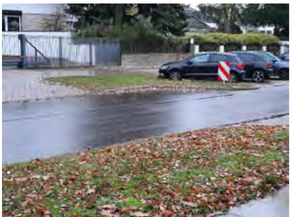
67 vor und gegenüber Böttcherkamp 76