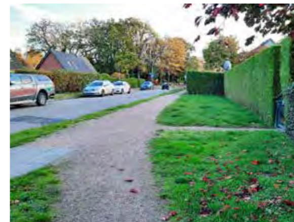
5 vor Jevenstedterstraße 183