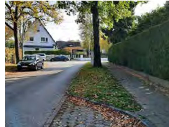
27 Glückstädterweg 2