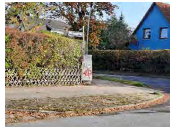
28 Glückstädterweg / Ecke Am Kratt