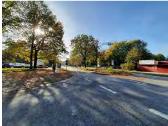
30 Bornheide / Ecke Böttcherkamp (3 Flächen)