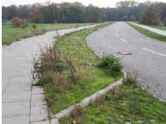
31 Elly-See-Str.: 8 Flächen im Straßenverlauf, Baumallee