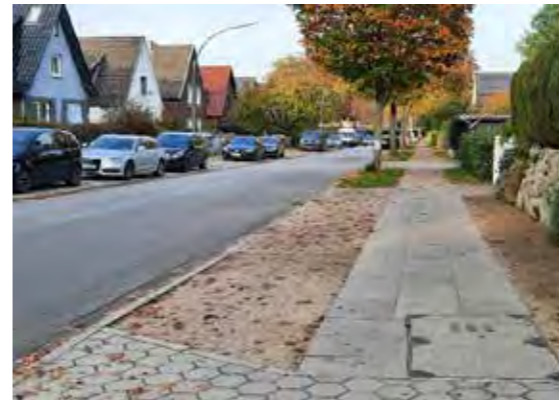
34 vor Flurstraße 33 + 39