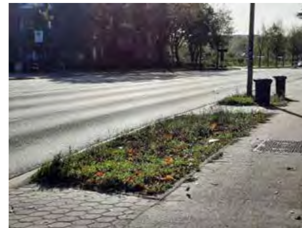
42 vor Elbgastraße 224