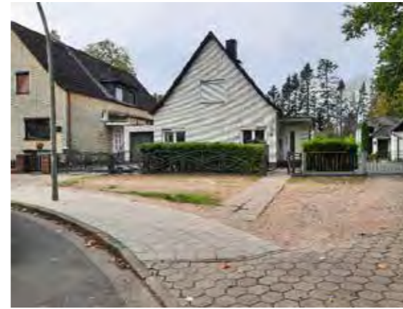
52 vor Böverstland 69