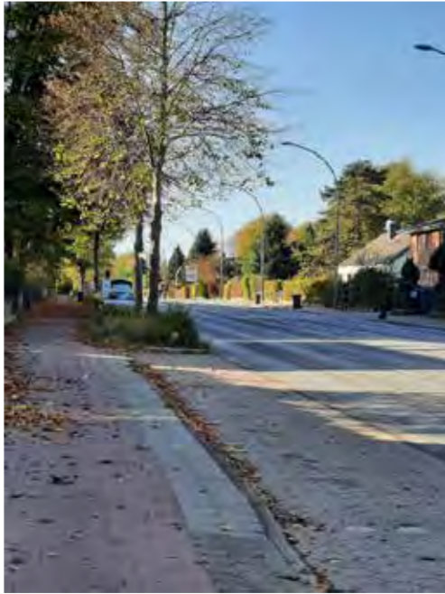
43 Farnhornweg: Anzahl P-plätze reduzieren, entsiegeln, Baumpflanzungen im Straßenverlauf