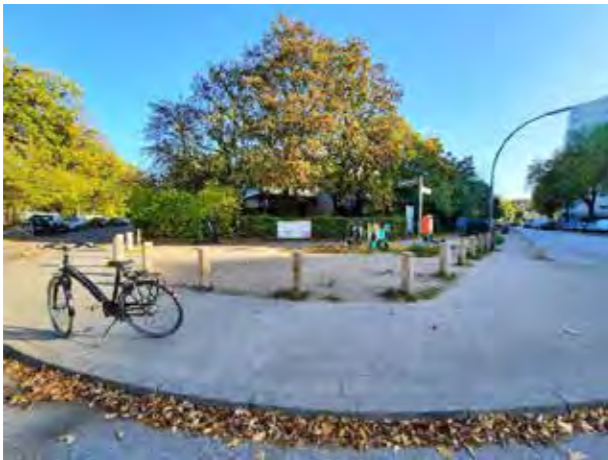
50 Langbargheide / Ecke Moorwisch