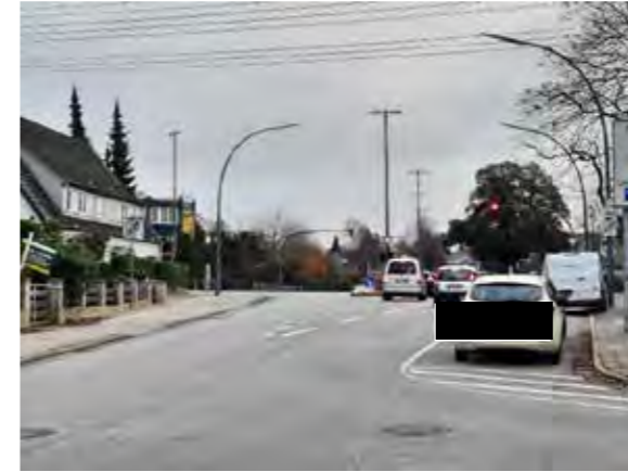
26 vor Flurstraße 85 – 89 beidseitig