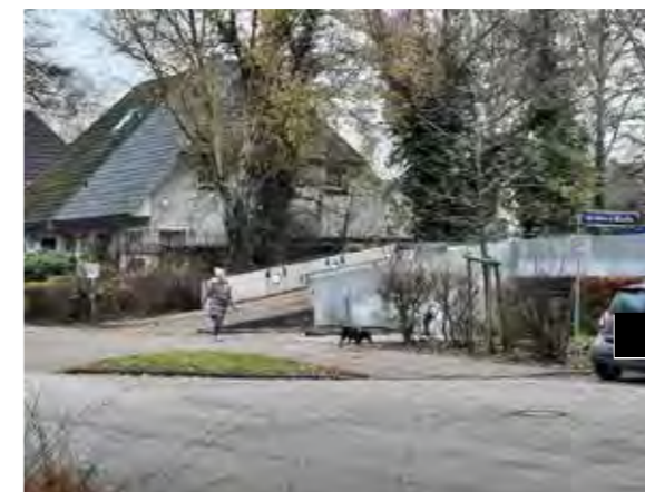
62 Kreisel Flurstraße / Böttcherkamp: Solitärbaum