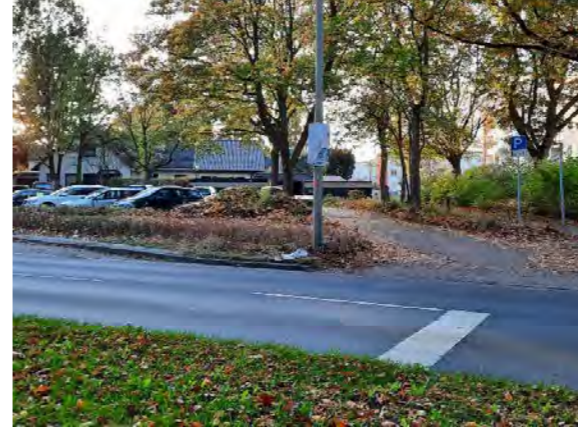
12 Elbgaustraße / neben Sommerweg