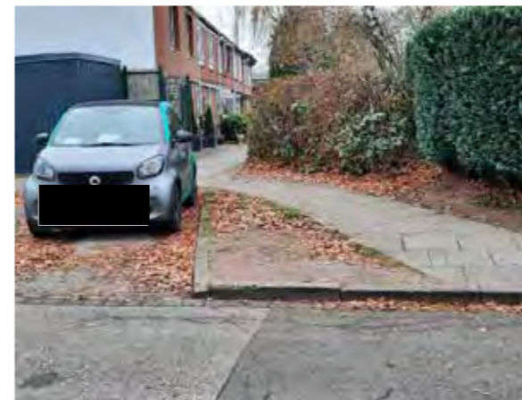
54 vor Peenestraße 36