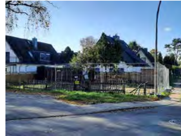
40 Franzosenkoppel / Ecke Sprützwiese