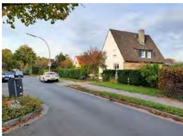
10 Jevenstedterstraße / gegenüber katholischer Kirche