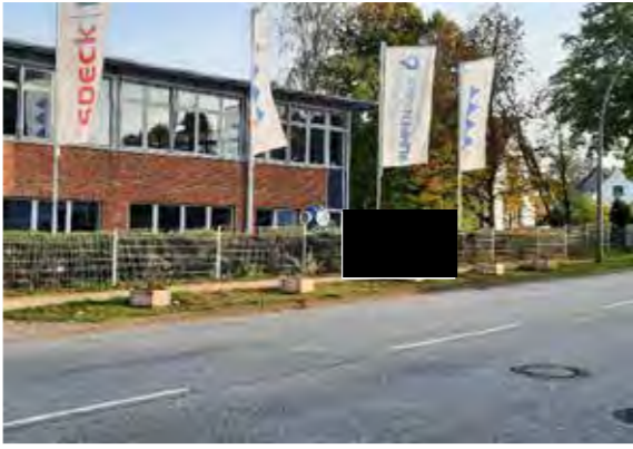
36 vor Flurstraße 105