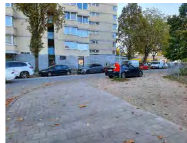
48 Langbargheide / Ecke Ammernweg