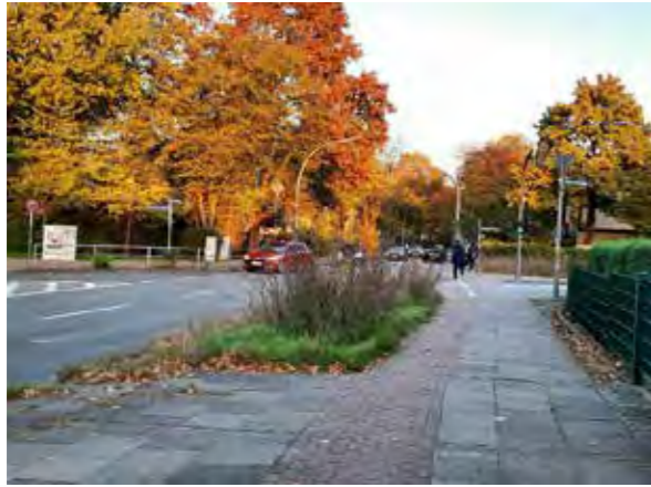
7 vor Fahrenort 1