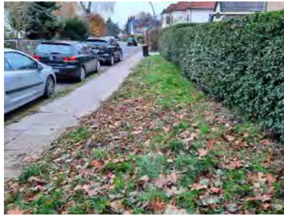
56 vor Sprützmoo76