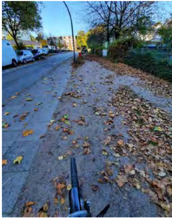
49 Langbargheide gegenüber Einkaufszentrum