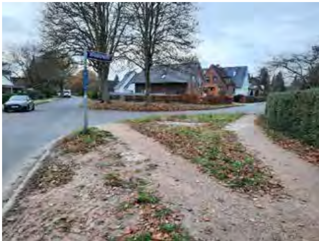
2 Ecke Flaßbarg / Brooksheide (Walnussbaum)