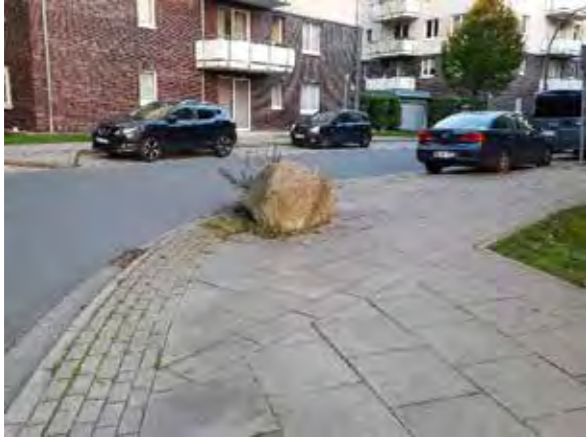
16 gegenüber Jan Külper Weg 12