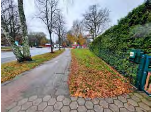
64 vor Böttcherkamp 200: Baumreihe