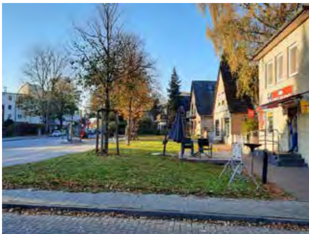
3 vor Luruper Hauptstraße 226 / 228, ergänzende Pflanzung