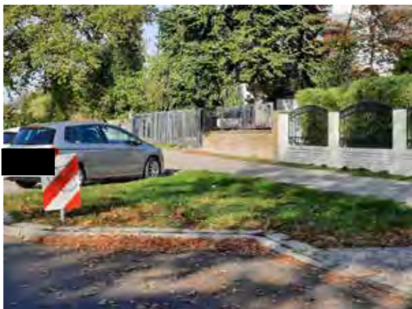
25 vor Böttcherkamp 76