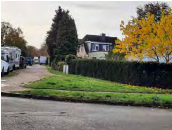
18 Kreuzung Kleiberweg / Jevestedterstraße