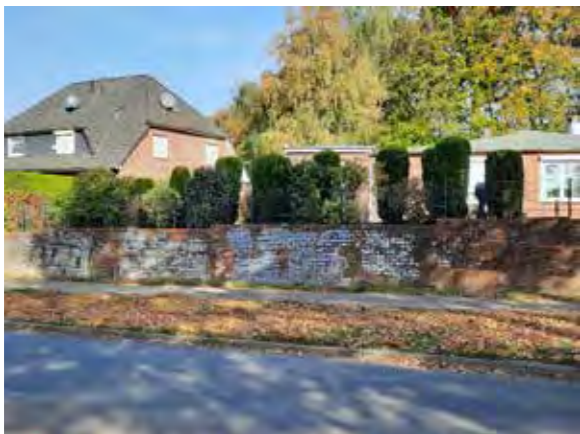
24 vor Böttcherkamp 88