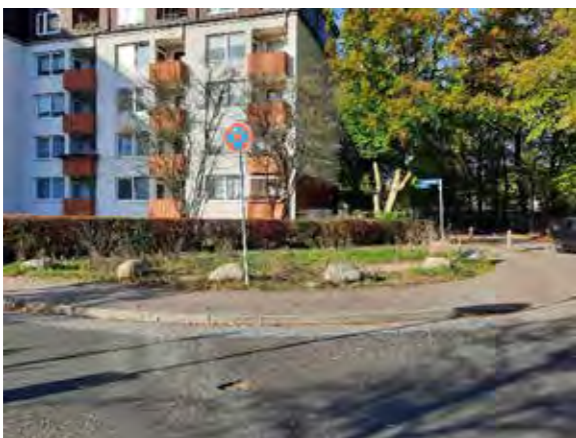
51 Langbargheide/ Ecke Lüdersring Nord