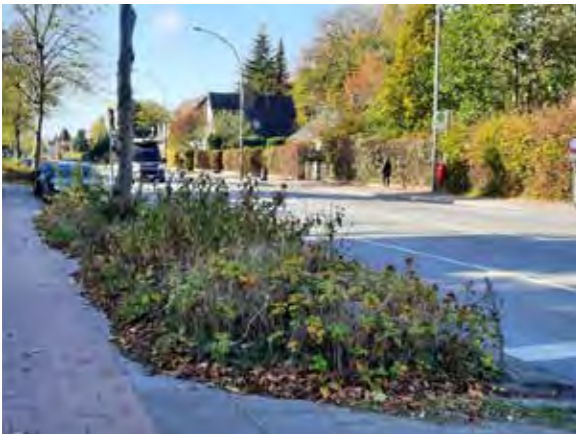
44 vor Farnhornweg 45