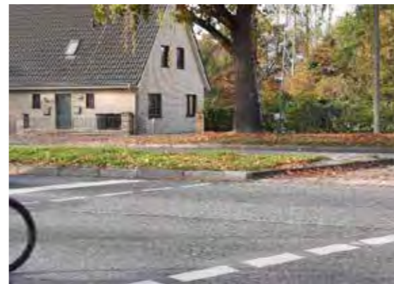
35 Kreuzung Flurstraße / Rugenbarg: Mittelinseln