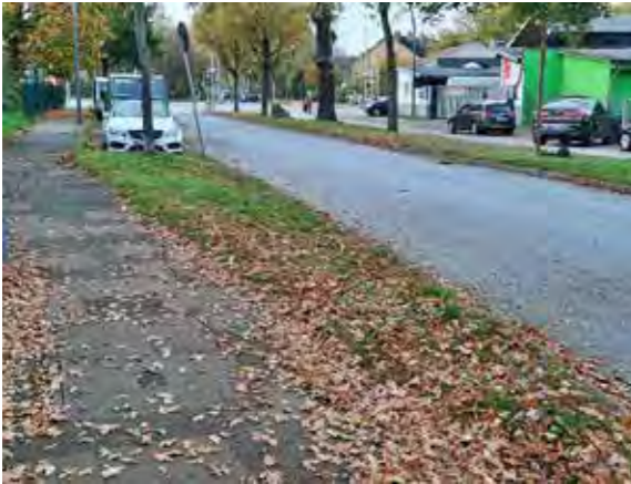
37 gegenüber Böttcherkamp 32