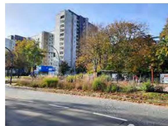
29 Bornheide / Ecke Kroonhorst