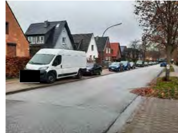
69 vor Flurstraße 24–40: durchgehenden Parkstreifen durch Baumstandorte umnutzen, Baumallee herstellen