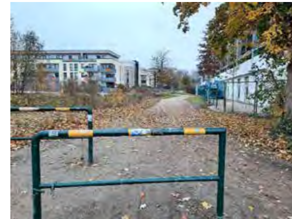
60 Vorhornweg: vorhandene Baumreihe verlängern