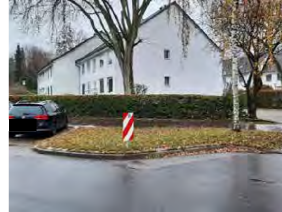
68 vor Böttcherkamp 49