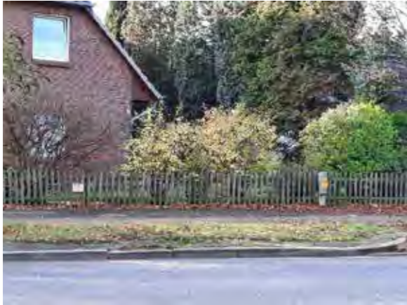
22 vor Am Barls 247