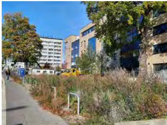
9 vor Luruper Hauptstraße 120