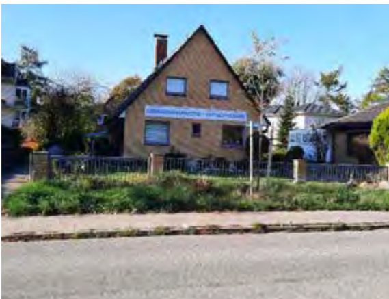
39 vor Lüttkamp 66