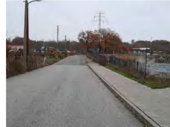
59 Lüttkamp: Baumallee zu beiden Parkanlagen