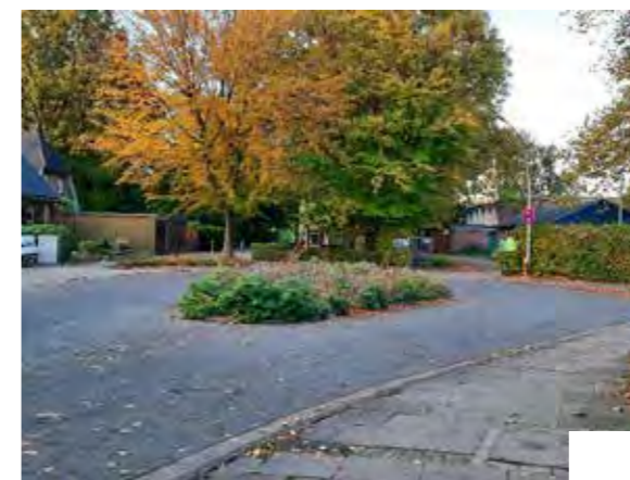
Veermoor Wendehammer, Solitärbaum