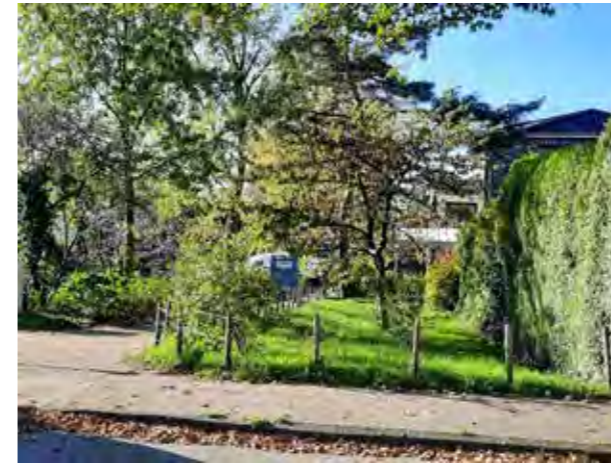
41 gegenüber Franzosenkoppel / Ecke Sprützwiese