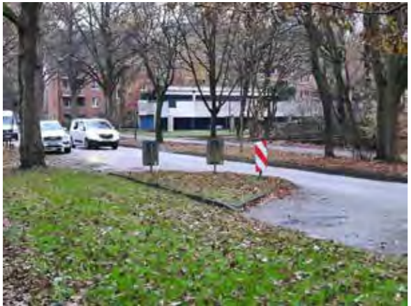
66 vor Böttcherkamp 174