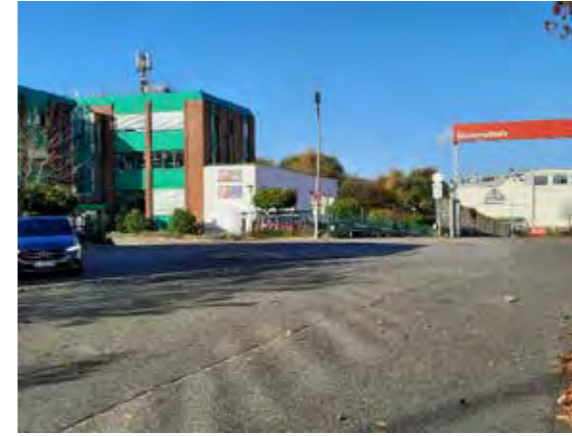
46 Hellgrundweg Wendehammer: Solitärbaum