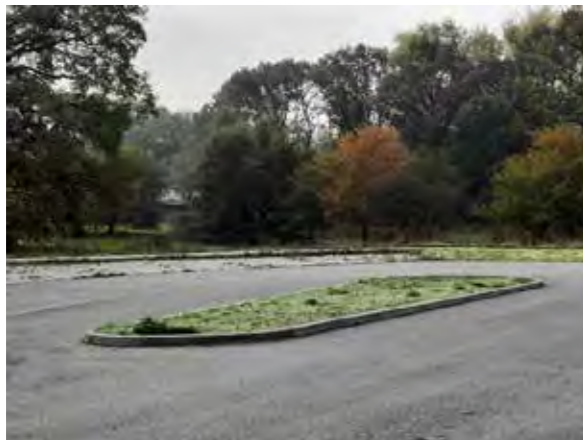
32 Elly-See-Str.: Flächen am Wendehammer