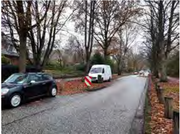
65 vor Böttcherkamp 176