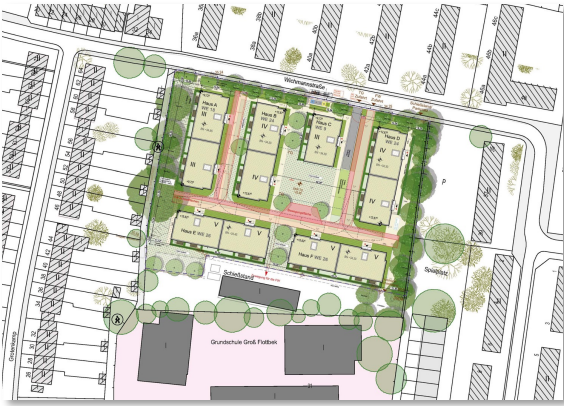
Vorschlag der Stadt