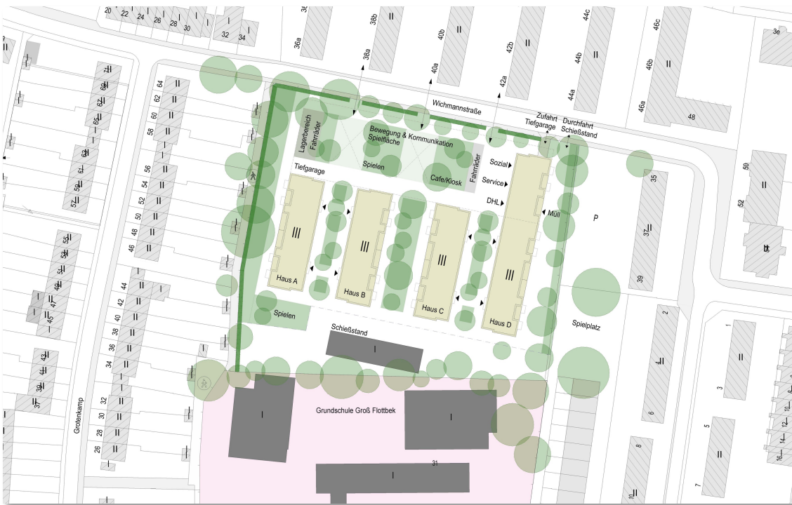
Vorschlag von B.U.N.T.

Inspiriert von der Idee der Vogelweide streben wir an, diesen Platz als Bindeglied zwischen der bestehenden und der neuen Anwohnerschaft zu etablieren, wo Menschen zusammenkommen, sich austauschen und Gemeinschaft und nachhaltige Teilhabe erleben.