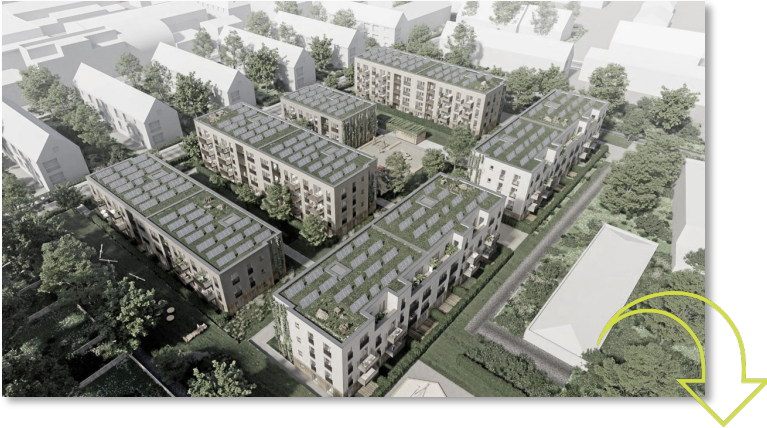
Vorschlag der Stadt