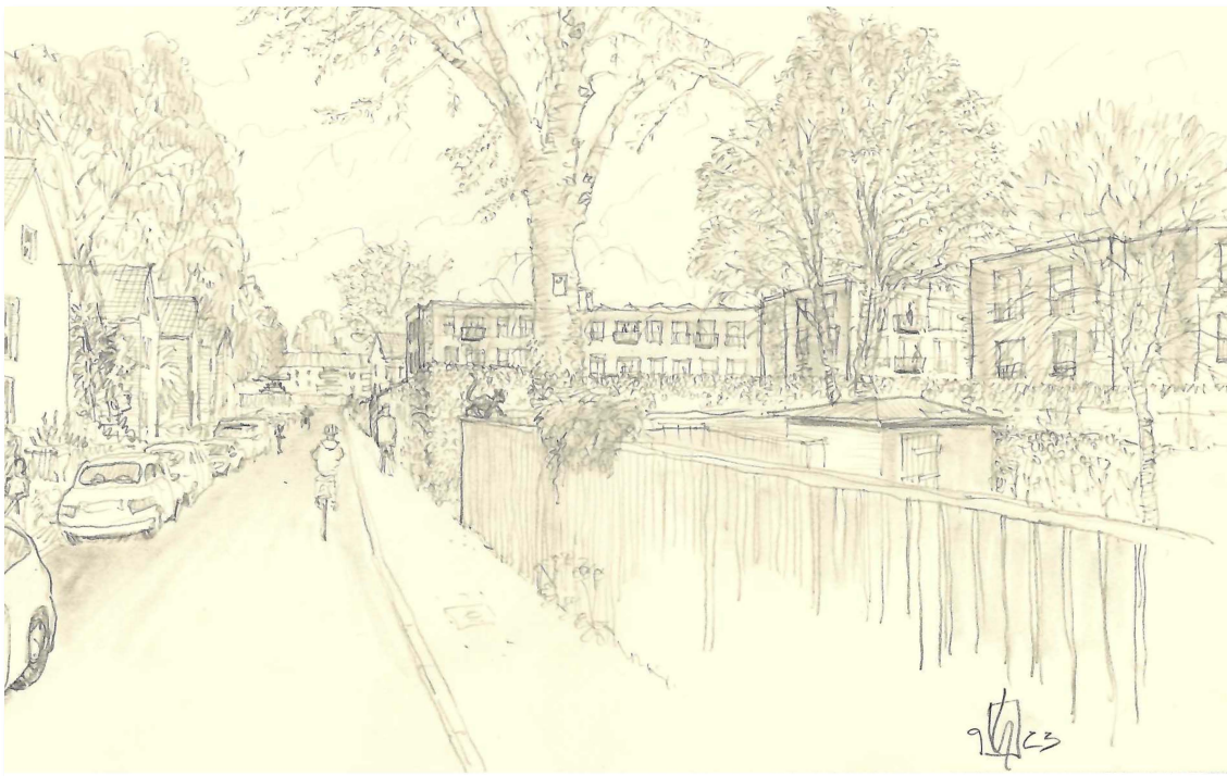
Vorschlag von B.U.N.T.