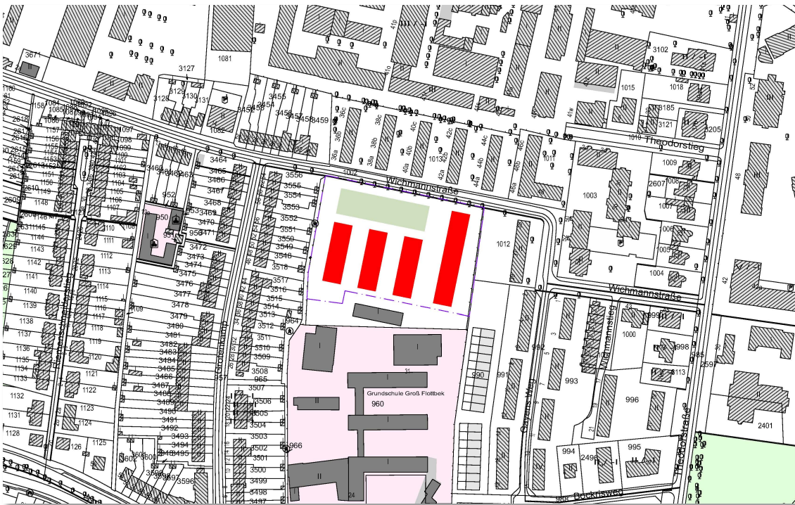
Vorschlag von B.U.N.T.