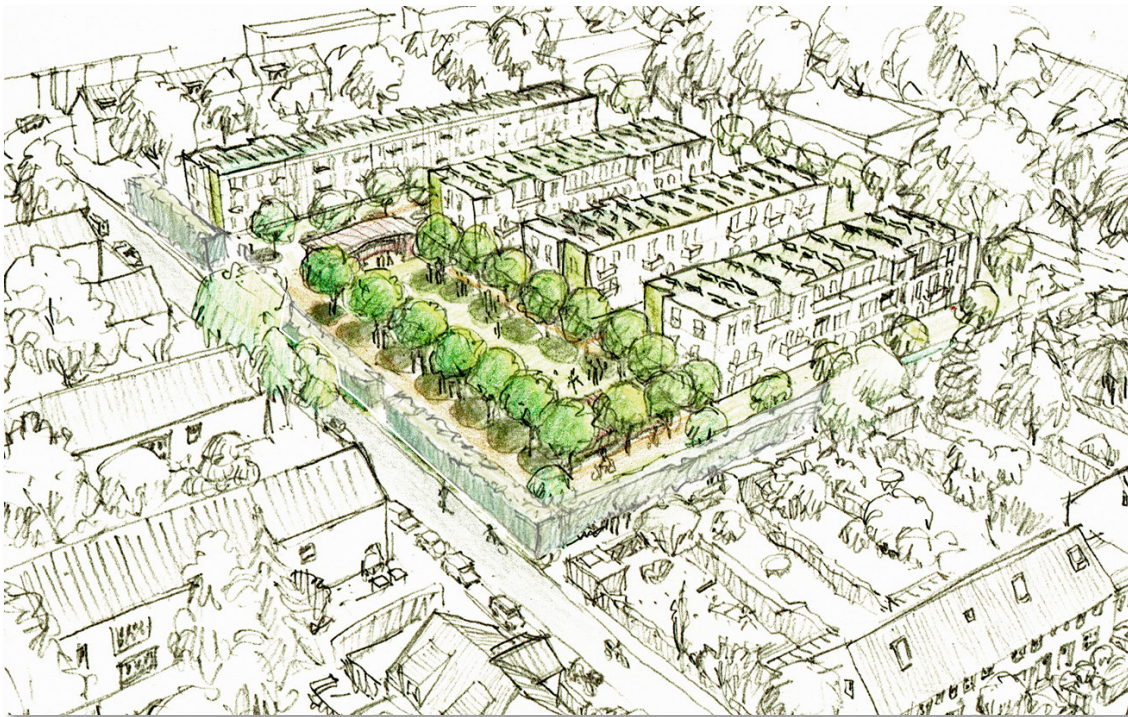
Vorschlag von B.U.N.T.