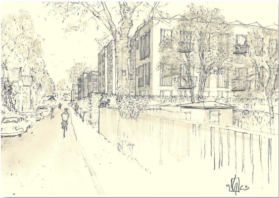
Vorschlag der Stadt