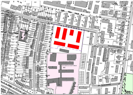
Vorschlag der Stadt