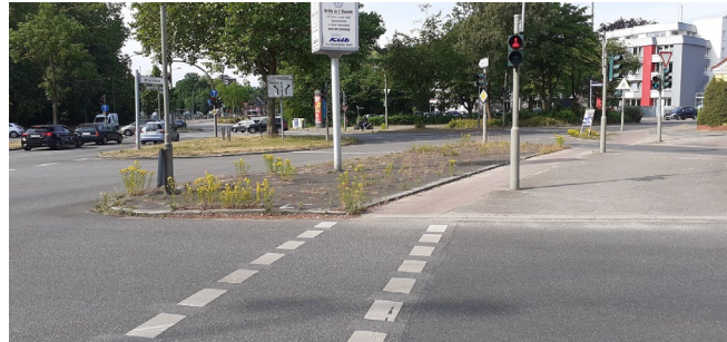
Kreuzung Berner Brücke, geschätzte Summe: ~ ca. 4.700,- € brutto