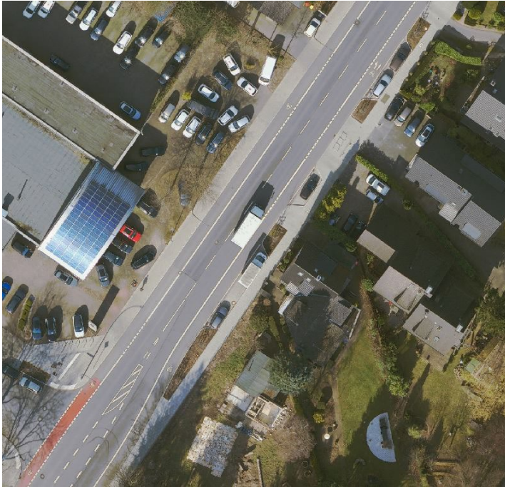
Auszug FHH- Atlas