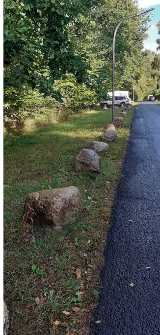
Foto: MR 31- Kurvenbereich vorher und nachher

Ansaat der ca. 1.000 qm großen Fläche mit Regionalsaatgut und naturnahe Abgrenzung mit Findlingen helfen das „Wilde Parken“ im Landschaftsschutzgebiet Rittmeisterkoppel einzudämmen.