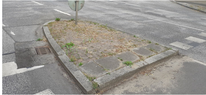
Alte Landstr. 115a