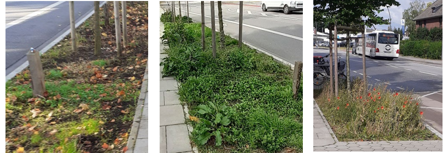
Foto: MR 31- vor und nach den Pflegegängen 1 und 2

Die Kuehnstraße wurde 2020 zur Veloroute 7 umgebaut und die anliegenden Pflanzinseln (insgesamt: 850 qm) zwischen Nr. 4 und Nr. 118 in 2022 angesät.