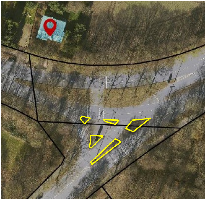
Auszug FHH- Atlas, Kreuzung Poppenbüttler Weg/ Hummelbüttler Weg