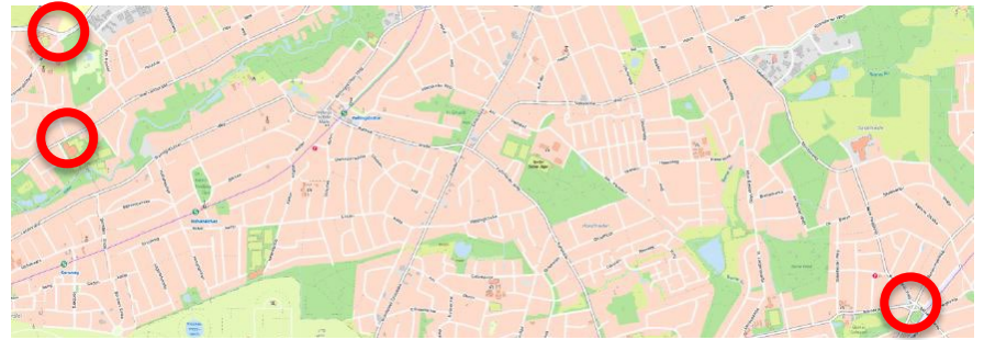
Auszug FHH- Atlas, alle geplanten zu bearbeitenden Straßenübergänge

In Kreuzungsbereichen in den Bezirken Hummelsbüttel und Farmsen-Berne (hier Poppenbüttler Weg 55) werden die Straßenbegleitgrünflächen an den Übergängen entsiegelt und mit niedrigen Gehölzen und einer niedrigen Blütensaatgut- Mischung eingesät.