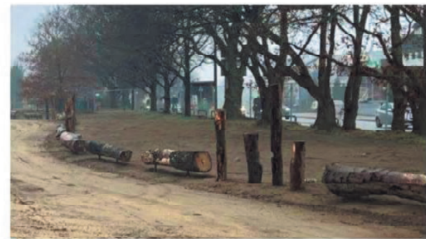
Beispiel Sicherung gegen Wildparken