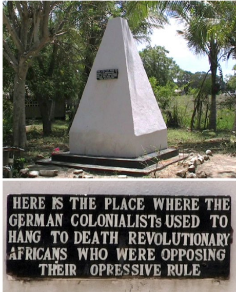
Erinnerungsort „German Hanging Tree“ in Bagamoyo/Tansania

Adolph Woermann und der Völkermord an den Herero und Nama , „Uns gehört Hereroland!“ zur Geschichte des antikolonialen Widerstands in Namibia“ - „Cornelius Fredericks, Führer der !Aman (Bethanier-Nama) gegen das Kolonialregime von ‚Deutsch-Südwestafrika‘“, in: Wanderausstellung freedom roads! koloniale straßennamen • postkoloniale erinnerungskultur (2010-2013)