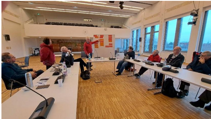
BSB-W Sitzung im Bürgersaal

Der BSB-W tagte – mit kurzer Unterbrechung (Corona) – in der Regel monatlich im Bürgersaal Wandsbek. Die Sitzungen waren öffentlich und wurden hybrid durchgeführt, Gäste konnten per ZOOM an den Plenumsitzungen teilnehmen.