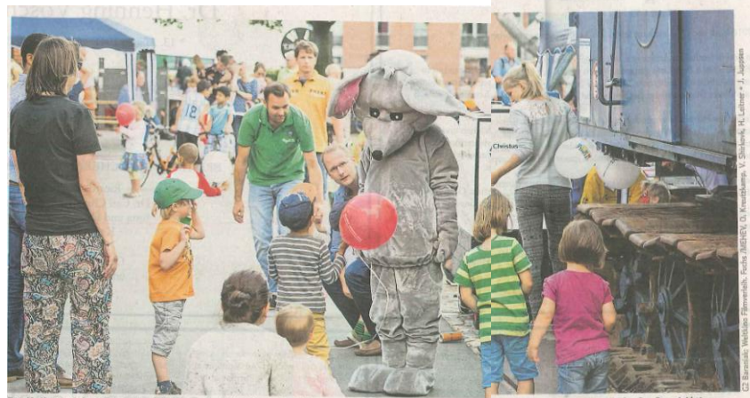
Das Hoffest auf dem Barmbeker Bert-Kaempfert-Platz bietet gleich hinter dem Museum der Arbeit schon am „onnabendnachmittag für Kinder Spaß und Aktionen