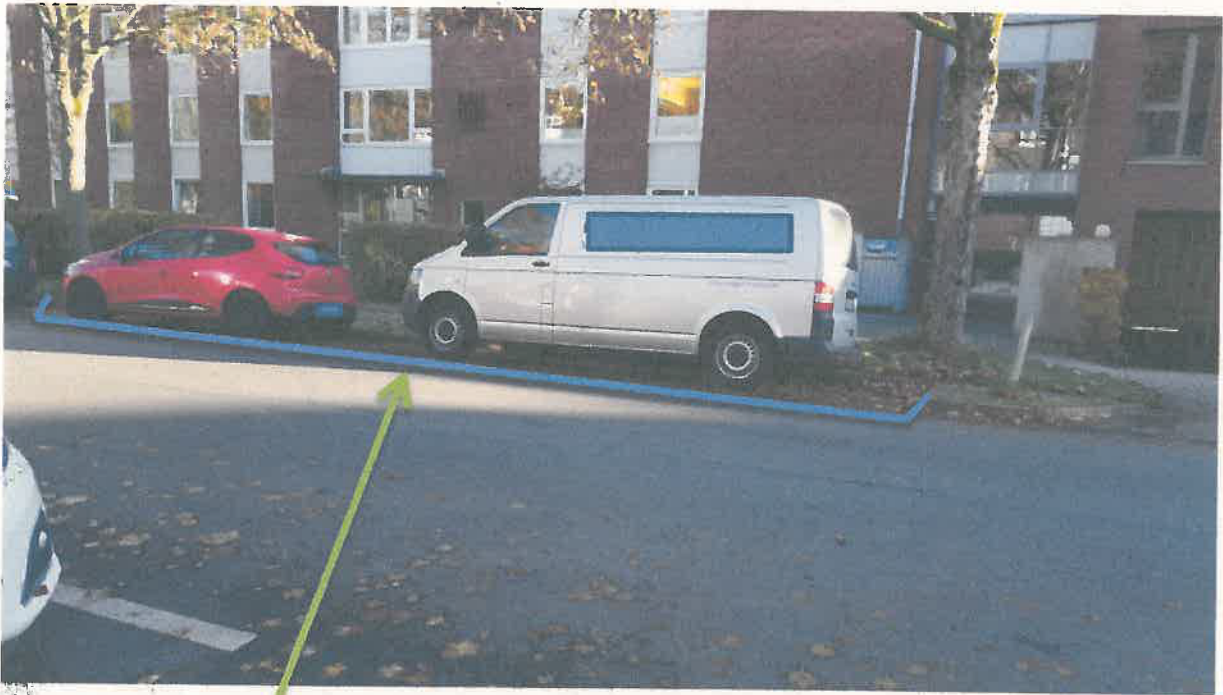
Foto zum o.a. Vorgang, E – Ladesäulenparkplätze Orchideenstieg 14

Geplante Fläche für die Sonderparkplätze, auf dem Seitenstreifen