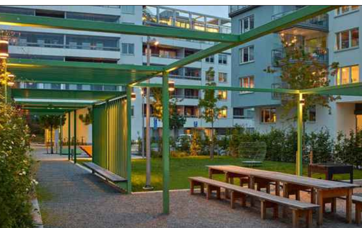
Sicht- und Sonnenfilter, Kommunikationsnischen