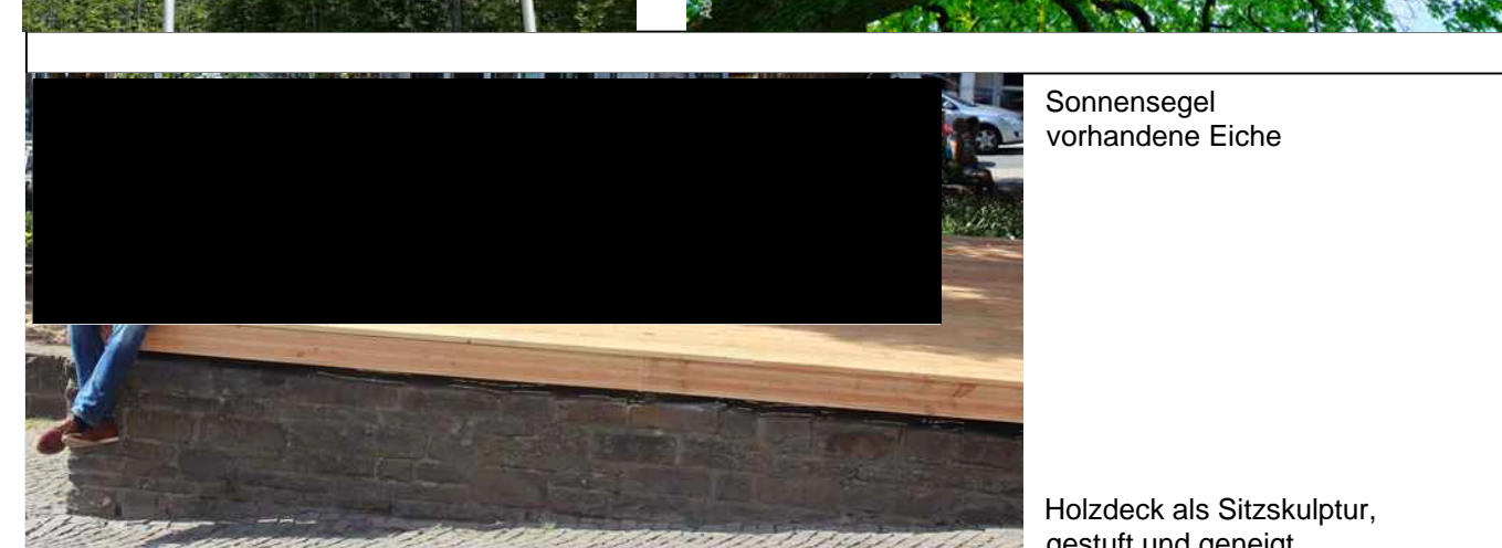
Sonnensegel vorhandene Eiche Holzdeck als Sitzskulptur, gestuft und geneigt