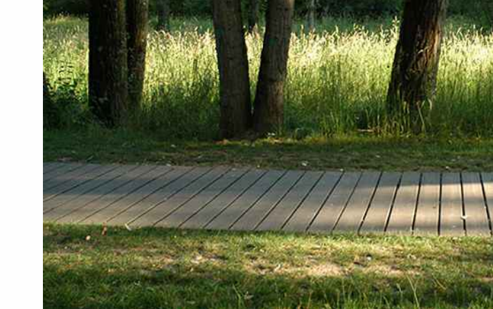
Wegeachse durch Baumbestand

Grüner Filter Baumkulisse Verknüpfung /Separierung von öffentlichem Quartiersplatz und halböffentlichem Quartiersinneren