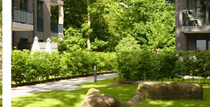
Quartiersgrün mit Hecken und altem Baumbestand