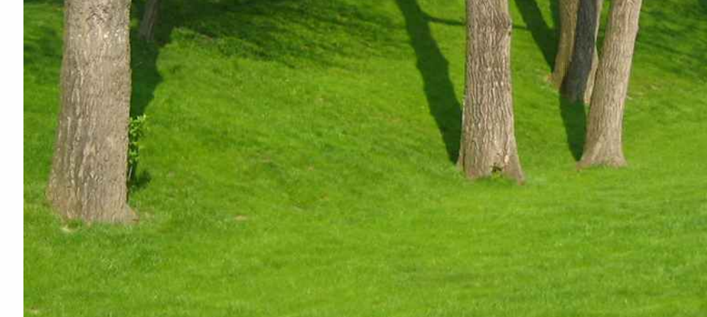
Bäume erhalten und integrieren

Grüner Filter Baumkulisse Verknüpfung /Separierung von öffentlichem Quartiersplatz und halböffentlichem Quartiersinneren