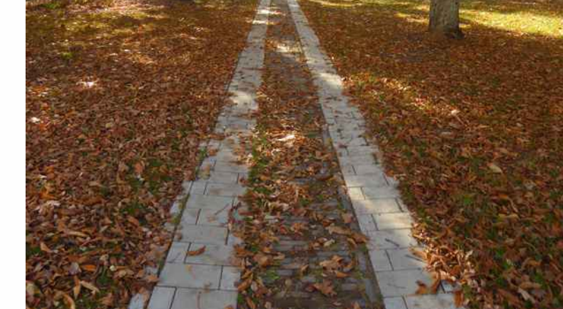
Wegeachse durch Baumbestand