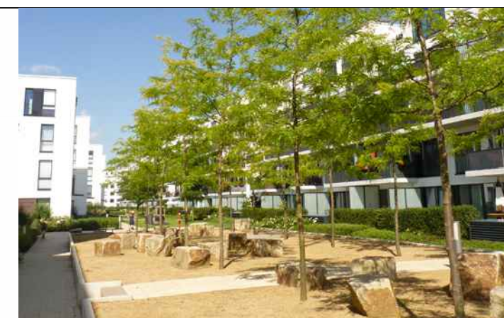
Wegeachse mit Aktionsräumen

Aktionskette naturnahe Materialauswahl mit punktuellen Farbtupfern nutzungsintensiven Quartiersinneren mit vielfältigen Aktions- & Kommunikationsangeboten entlang einer verbindenden Wegeachse: - Spiele für die Kleinen - Nischen für die Großen - autofreie Durchwegung für Alle