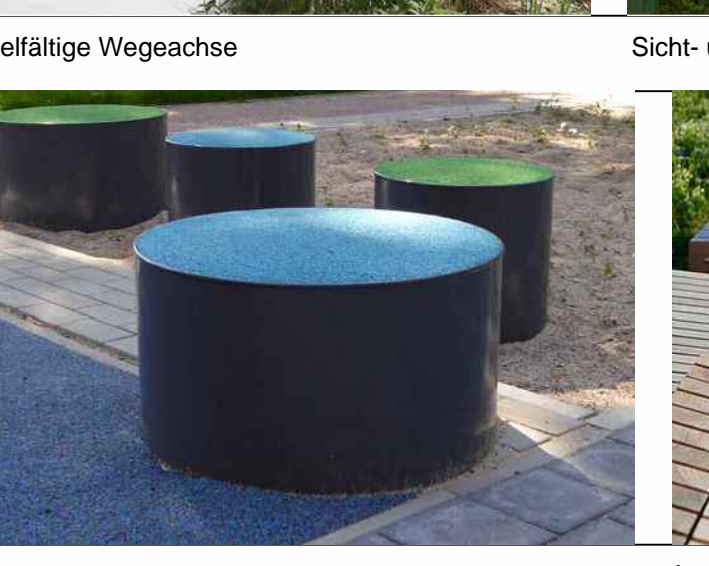
Lounger für Groß & Klein