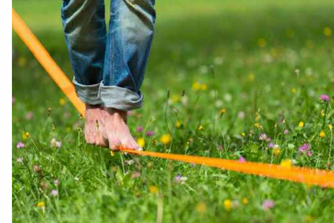
SlackLine zwischen Bäumen