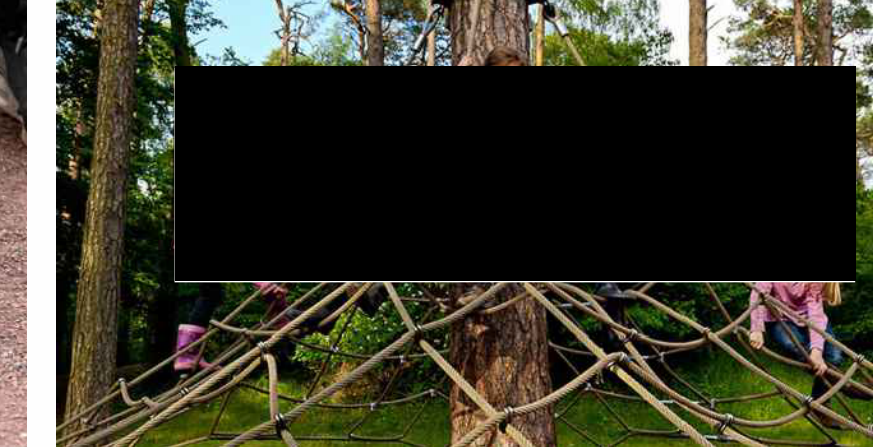
Spielen mit Bäumen