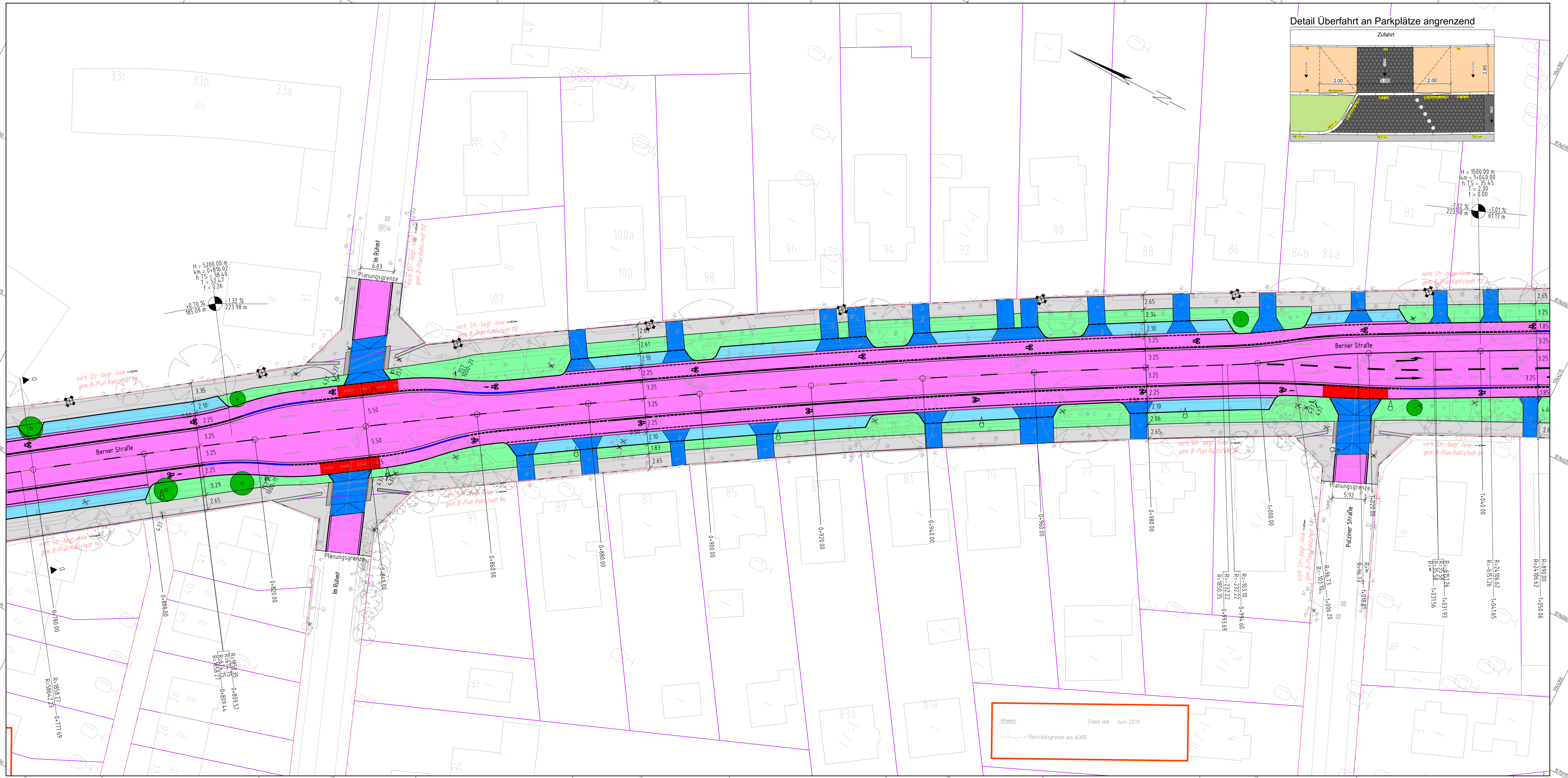
Detail Überfahrt an Parkplätze angrenzend