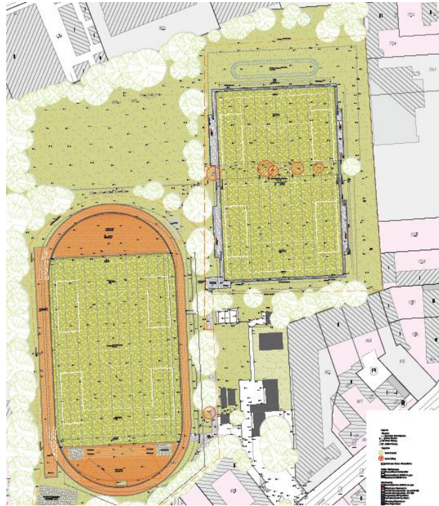
Waldsdorferstraße (2. BA), Wandsbek