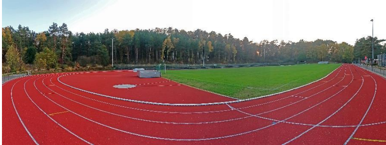
Cuxhavener Straße, Harburg