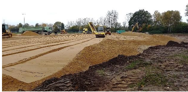
Mittlerer Landweg, Bergedorf