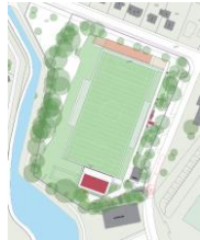
Ladenbeker Weg, Bergedorf