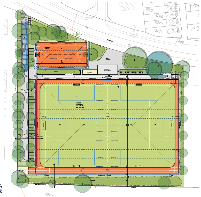
Am Neumarkt, Wandsbek