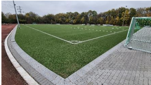
Berner Heerweg, Wandsbek