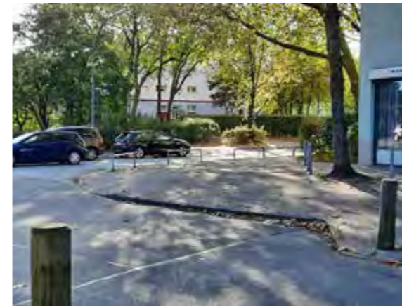
47 Langbargheide / Ecke Lüdersring Süd