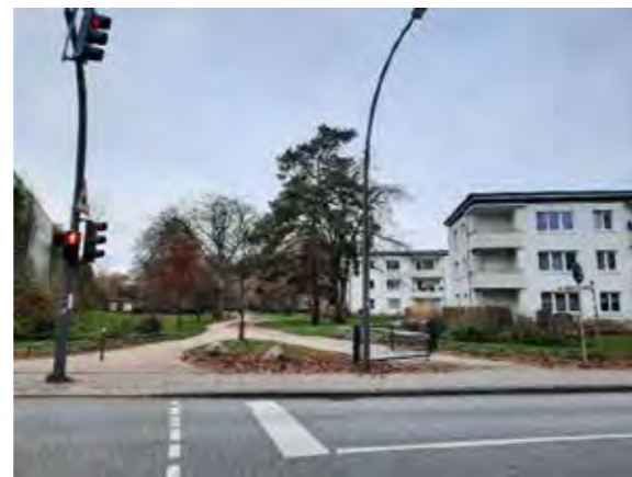
59 Lüttkamp: Baumallee zu beiden Parkanlagen