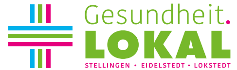
Das Logo vom neuen Stadtteilgesundheitszentrum im Quartier Alten Eichen

LOKAL aufgenommen werden. Dazu führt das Team Gespräche mit Menschen aus dem Einzugsgebiet von Gesundheit. LOKAL - also Stellingen, Eidelstedt und Lokstedt.