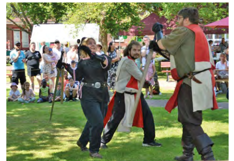
Schwertkämpfer in Aktion

Für jede und jeden war wieder etwas dabei: Kinder-Olympiade und -Schminken, Kistenklettern, Zaubershow, Hüpfburg sowie Ponyreiten für die Kleinen, Flohmarkt, kulinarische Leckerbissen, Cafeteria, Show-Schwertkämpfe und mitreissende Musik für die Großen. Und natürlich viele Info-Stände. Wir danken allen Mitarbeiter*innen, Ehrenamtlichen, Schüler*innen und Bewohner*innen, die sich beim Fest engagiert haben!