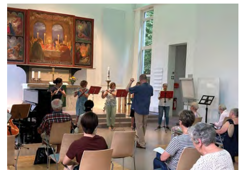
Kleines Konzert in der Kirche