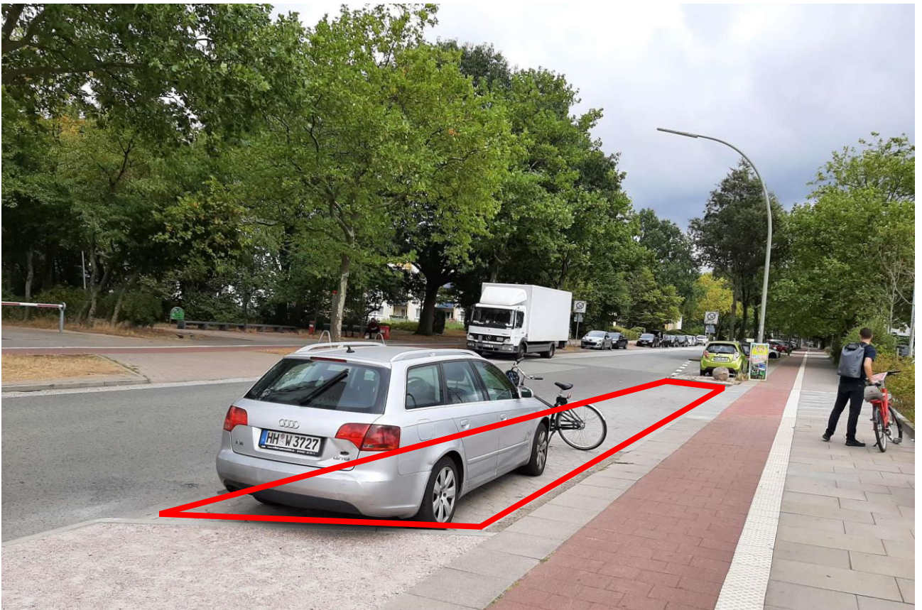
Variante 2: längere Parkbuchte direkt vor Aldi