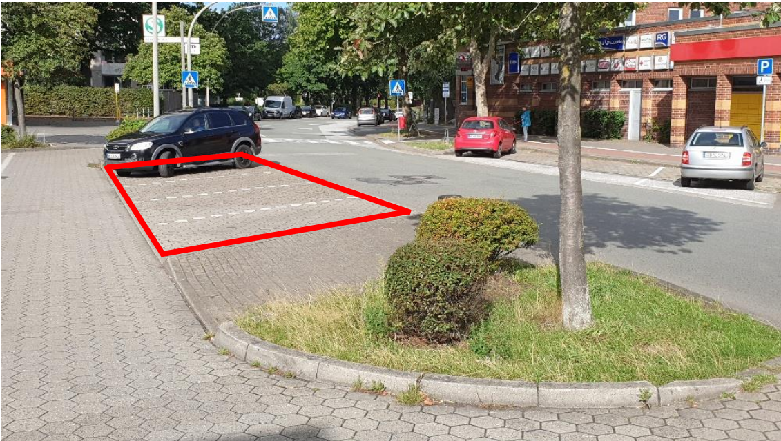
Variante 1: Südseite Striepenweg, Parkfläche zwischen Fahrbahn und Nebenfahrbahn