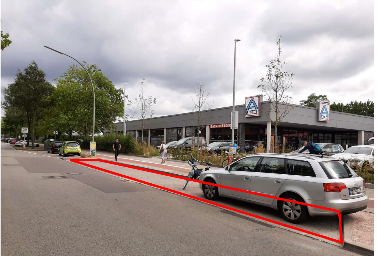
Variante 2: längere Parkbuchte direkt vor Aldi