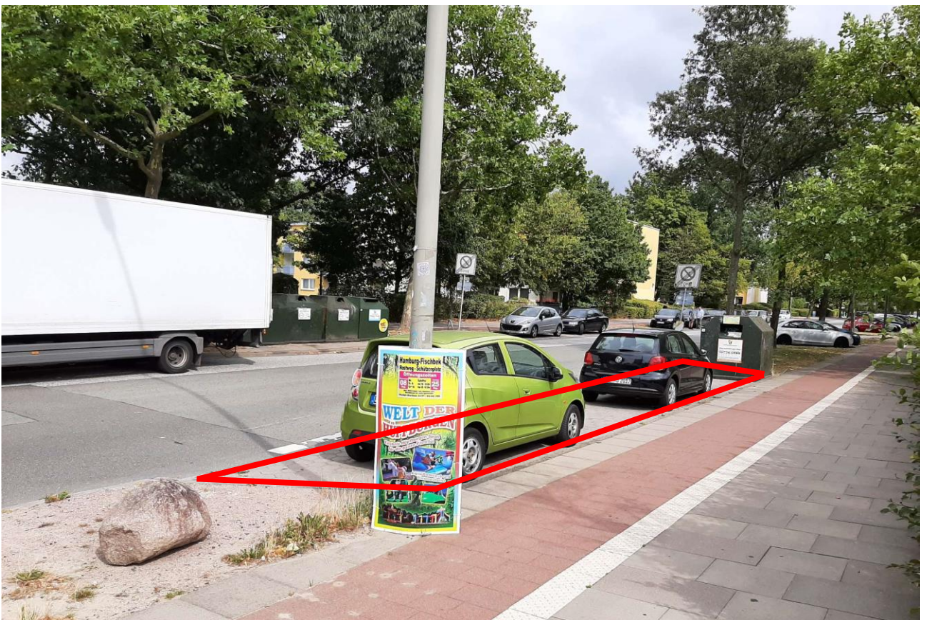
Variante 3: kürzere Parkbuchung direkt vor Aldi