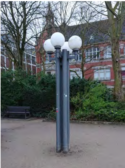
Bild 1. Intakte Lampe.