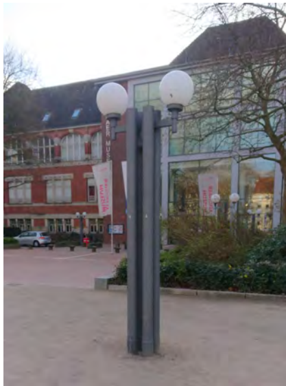
Bild 2. Nur zwei Leuchtkugeln.