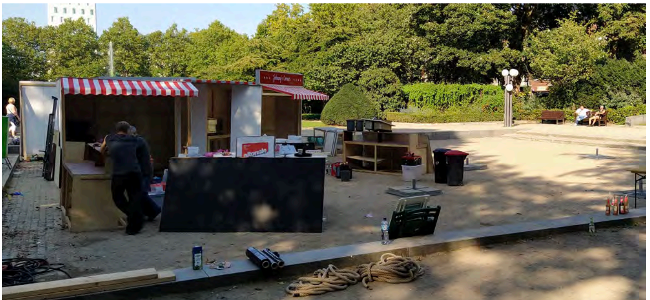
Bild 4. Das „Altonale“-Equipment ist schon weitgehend abgebaut. Hinten rechts sieht man die beschädigte Lampe aus Bild 3, bevor die Leuchtkugeln abgebaut wurden. Foto vom 14.09.2020.