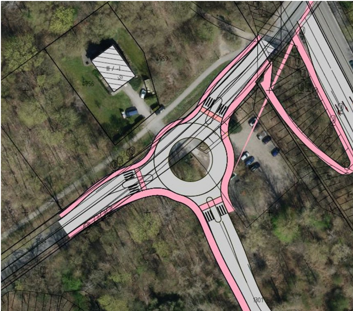
(LSBG, Äußere Erschließung Oberbillwerder, Varianten zum Knotenpunkt am Ladenbeker Furtweg, SEA 21.04.2022)