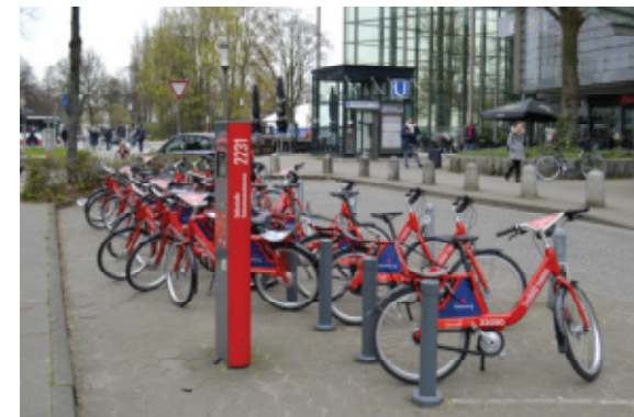
Bilder: Bezirksamt Eimsbüttel