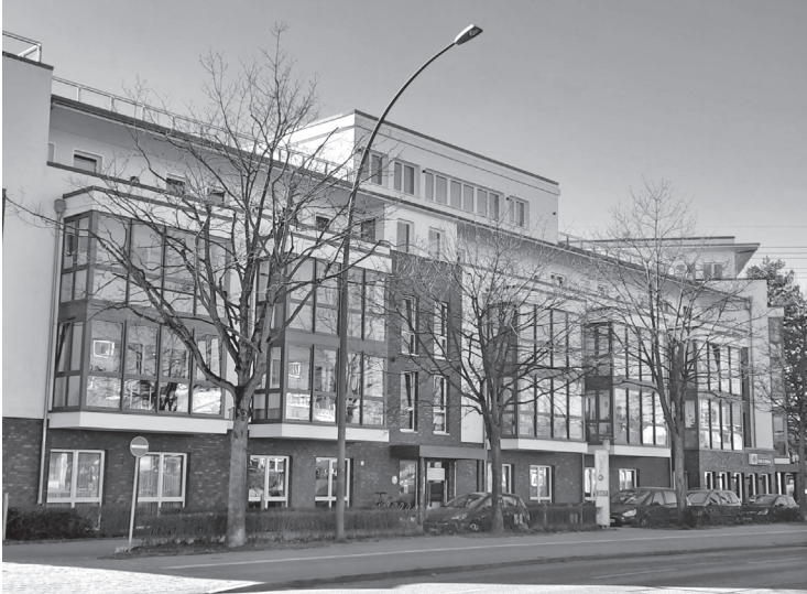
Die FAMA Altenwohnanlage ist ein positives Beispiel für einen Neubau an der Magistrale: Ansprechend gestaltete Fassade, ausreichend Abstand zum Straßenrand, Bäume und Begrünung.

Variationen in der Formensprache und Gebäudehöhe, Terrassierungen, helle Fassaden, Wintergärten, Arkaden... Jedoch keinesfalls dunkle, fensterlose Fassaden oder Lochfassaden.