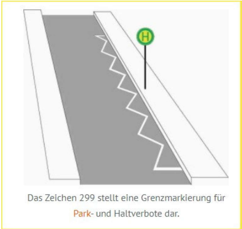
Beispiel einer Markierung