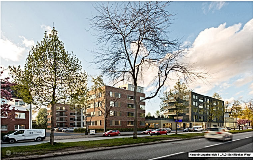
Neubaubereich 1 „AED Schiller Weg“