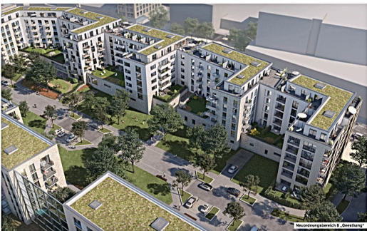
Neubaubereich 3 „Zooanlage“