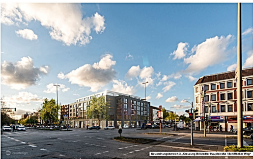
Neubaubereich 2 „Kreuzung Brähler Hauptstraße / Schiller Weg“