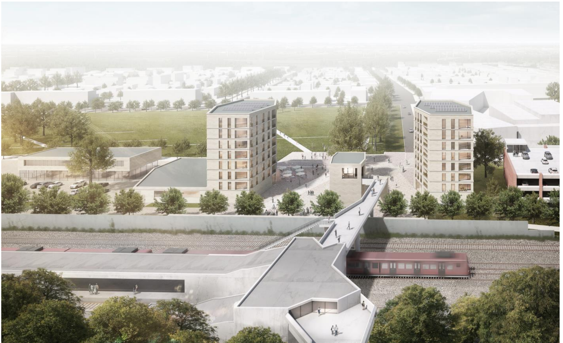
Vogelperspektive von Süden