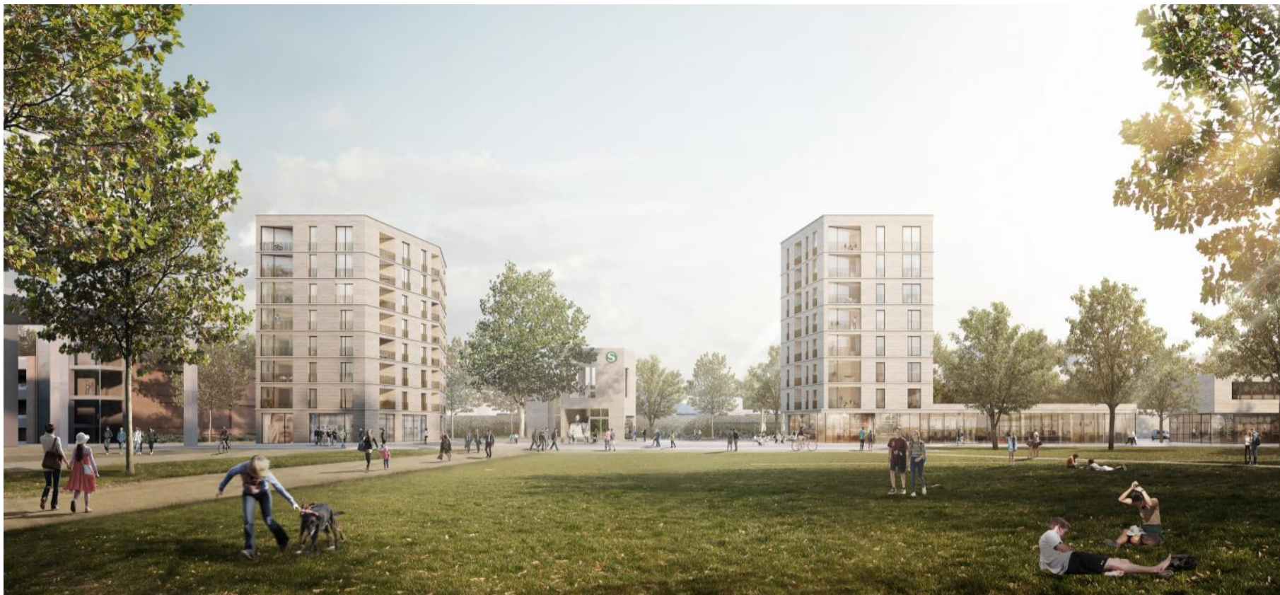
Perspektive aus dem Quartierspark

Ca. 70 WE zzgl. Gewerbe ca. 9.800m 2 BGF