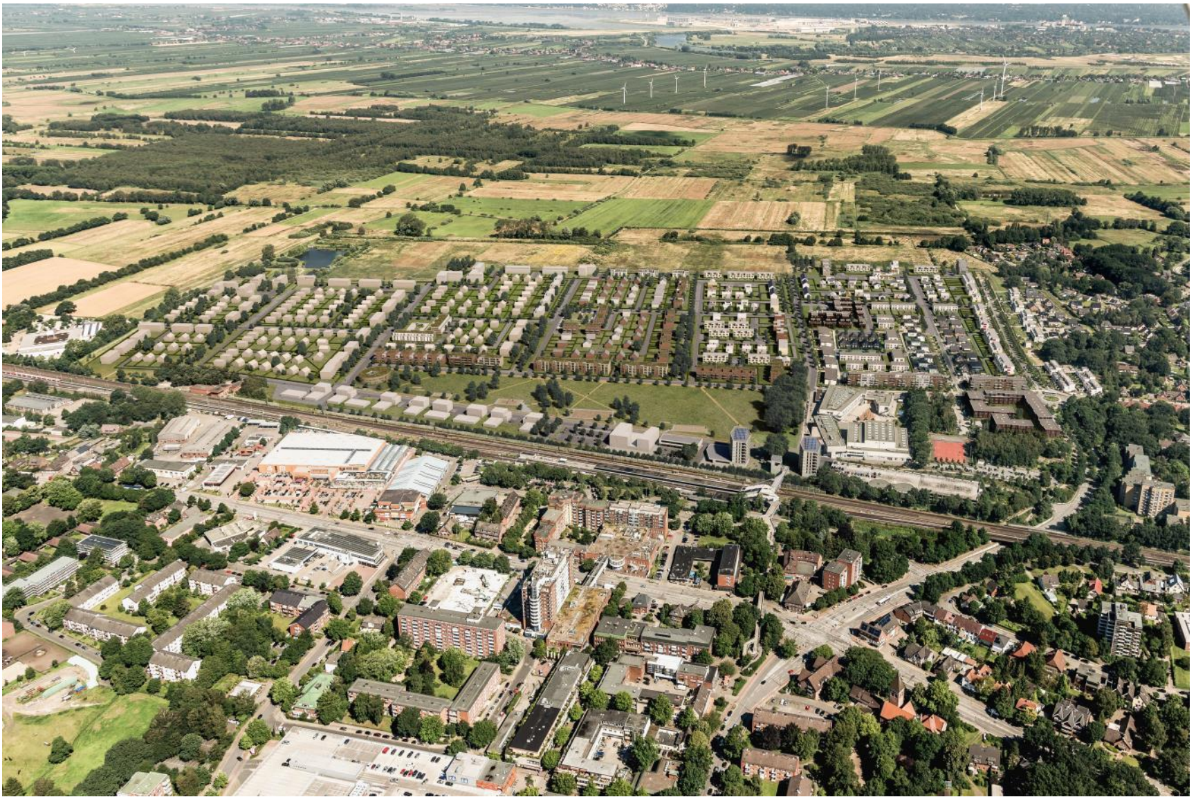
Visualisierung mit Quartierseingang