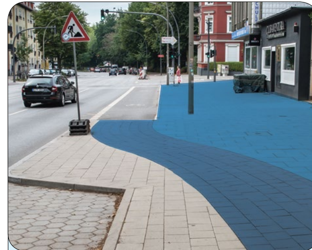
Radweg mit Hochbord / Wechsel Radweg auf Fahrbahn: