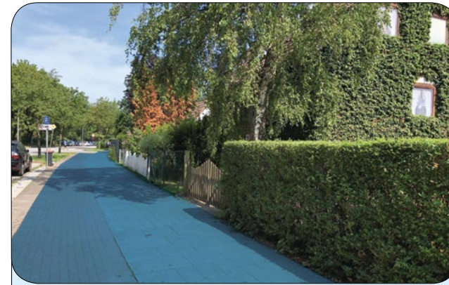
Auf dem eigenen Grundstück gepflanzte Hecken sind bis zur Grundstücksgrenze zurückzuschneiden. Auf dem Grundstück befindliche Bäume müssen eine lichte Höhe von 2,5 m aufweisen.