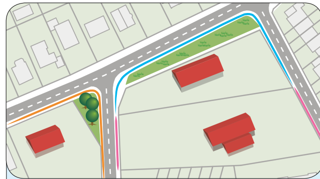
Böschungen, Gräben, Stützmauern etc. und auch Trennwände entbinden Sie nicht von Ihrer Reinigungspflicht als Anlieger.