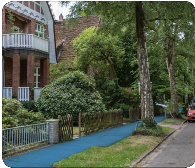
Gehweg z. B. mit Seitenstreifen / Straßenbegleitgrün

Für den Winterdienst gelten gesonderte Regelungen.