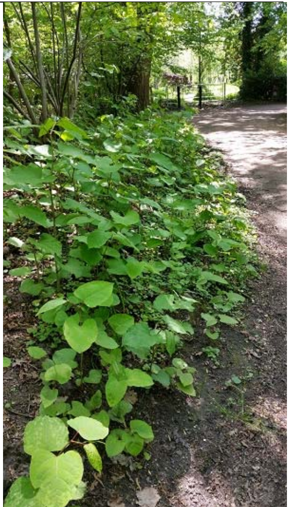
Anny-Tollens-Weg/ Ecke Rahlstedter Kirchenstieg