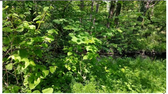
Wandse bei der Stein-Hardenberg-Straße