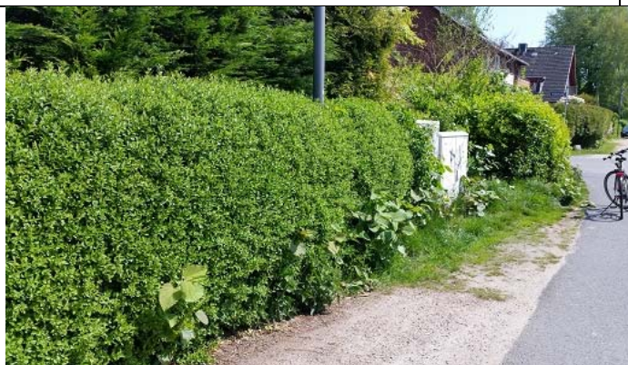
Köderheide/Ecke Am Hegen