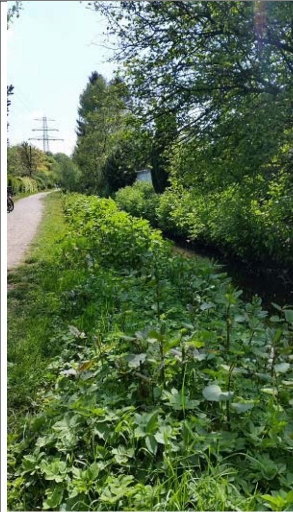
Berner Au beim Spielplatz Wiesengrund